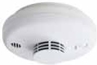
天井取り付け式火災警報器