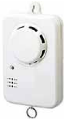
壁取り付け式火災警報器