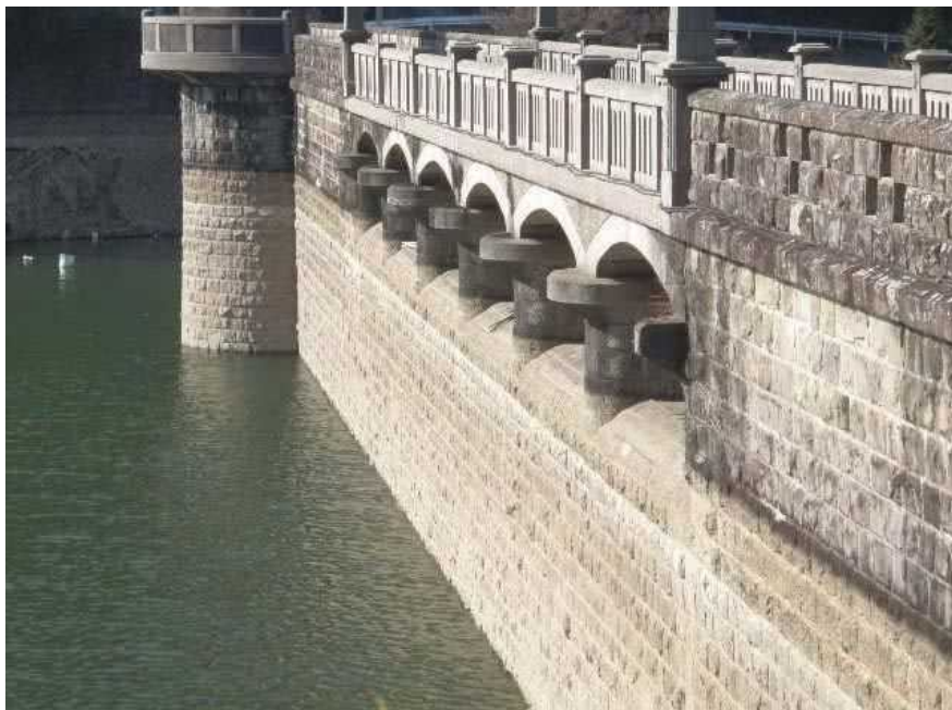
洪水吐 越流堰 コンクリート W 上36.00 下36.00 H 1.40