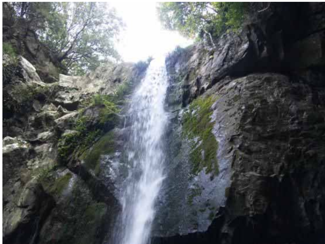
鮎屋の滝