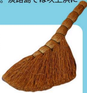
鳥取県のぱりんぼうき

地下には、太さ1mmくらいの根が長くまっすぐにのびている。吹上地区では、ケカモノハシを「かるかや」と呼び、昭和の中頃まで、この根でタワシを作っていた。鳥取県では、この根でほうきを作っていた。