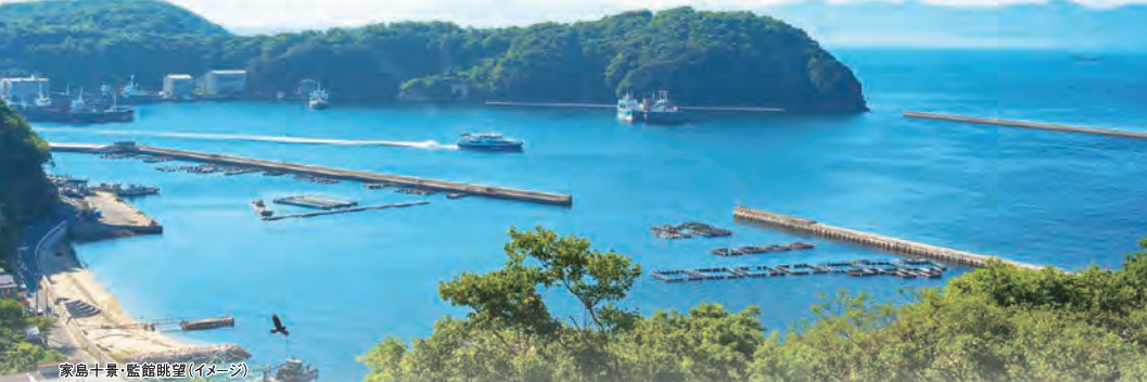
家島十景：監館眺望(イメージ)