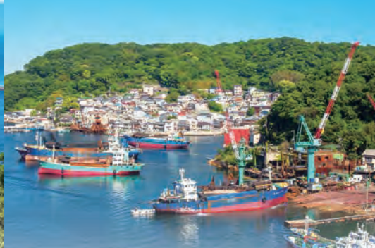
家島十景：間浦古郭(イメージ)

■旅行代金／おひとり様 おとな 6,500円 ども 5,000円 (小学生以上中学生以下)