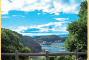
家島本島 宮地区(清水公園/監館眺望)