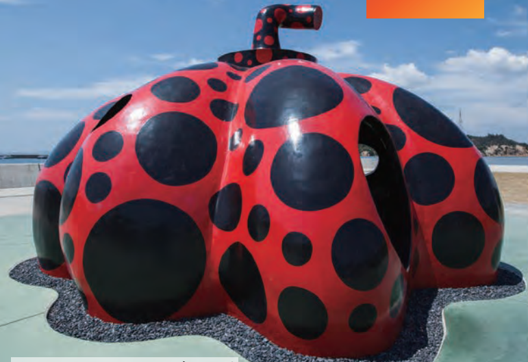
草間彌生「赤かぼちゃ」 2006年 直島・宮浦港緑地 水玉の真っ赤な姿は、港に近づく と真っ先に目に入ってきます。

おとな 旅行代金/おひとり様 6,500円 こども(小学生以上中学生以下) 5,000円