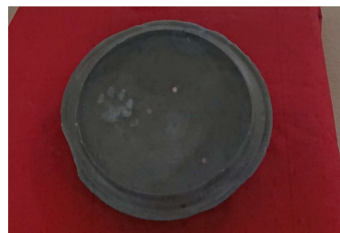
見野の郷交流館に展示されている猫と思われる動物の足跡の付いた須恵器のレプリカ