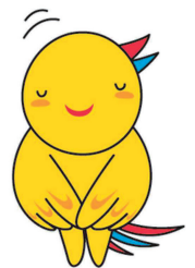
兵庫県マスコット はげたん