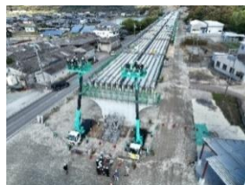
東播磨道 工事現場