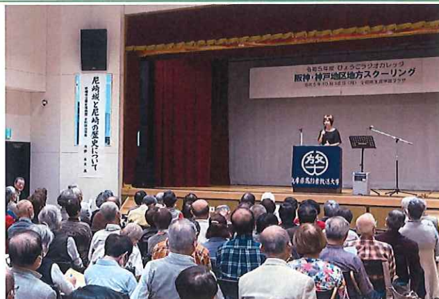
地方スクーリングの様子