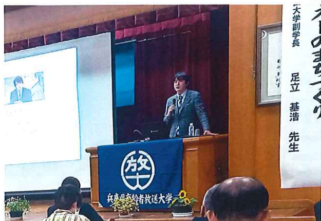
中央スクーリングでの講義