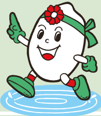
稲美町 イメージキャラクター いなっち