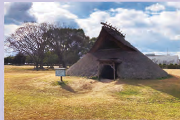
播磨大中国古代の村

弥生時代後期から古墳時代初頭の遺跡「大中遺跡」に代表される、古代までさかのぼる歴史があり、町政施行前の村名「阿閉」は播磨風土記にも記載があります。日本人として初めてアメリカ大統領に謁見し、のちに日本で最初の新聞である「海外新聞」を発刊したジョセフ・ヒコの生誕地としても知られています。廃線跡を利用した緑道や寺社仏閣をはじめとする歴史的建造物の景観が保全されていて、自然と親しみながら観光を楽しめます。