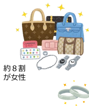
品目別ワースト5 (2021年度)