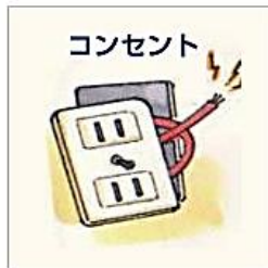
コンセントが破損している…