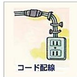
コードを釘などで固定してしまった…