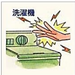
洗濯機を触ると電気のびりびりを感じる…