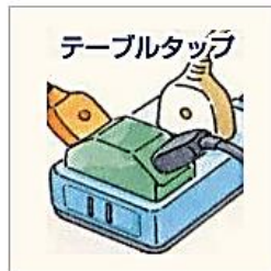
タコ足配線をしていて過熱している…