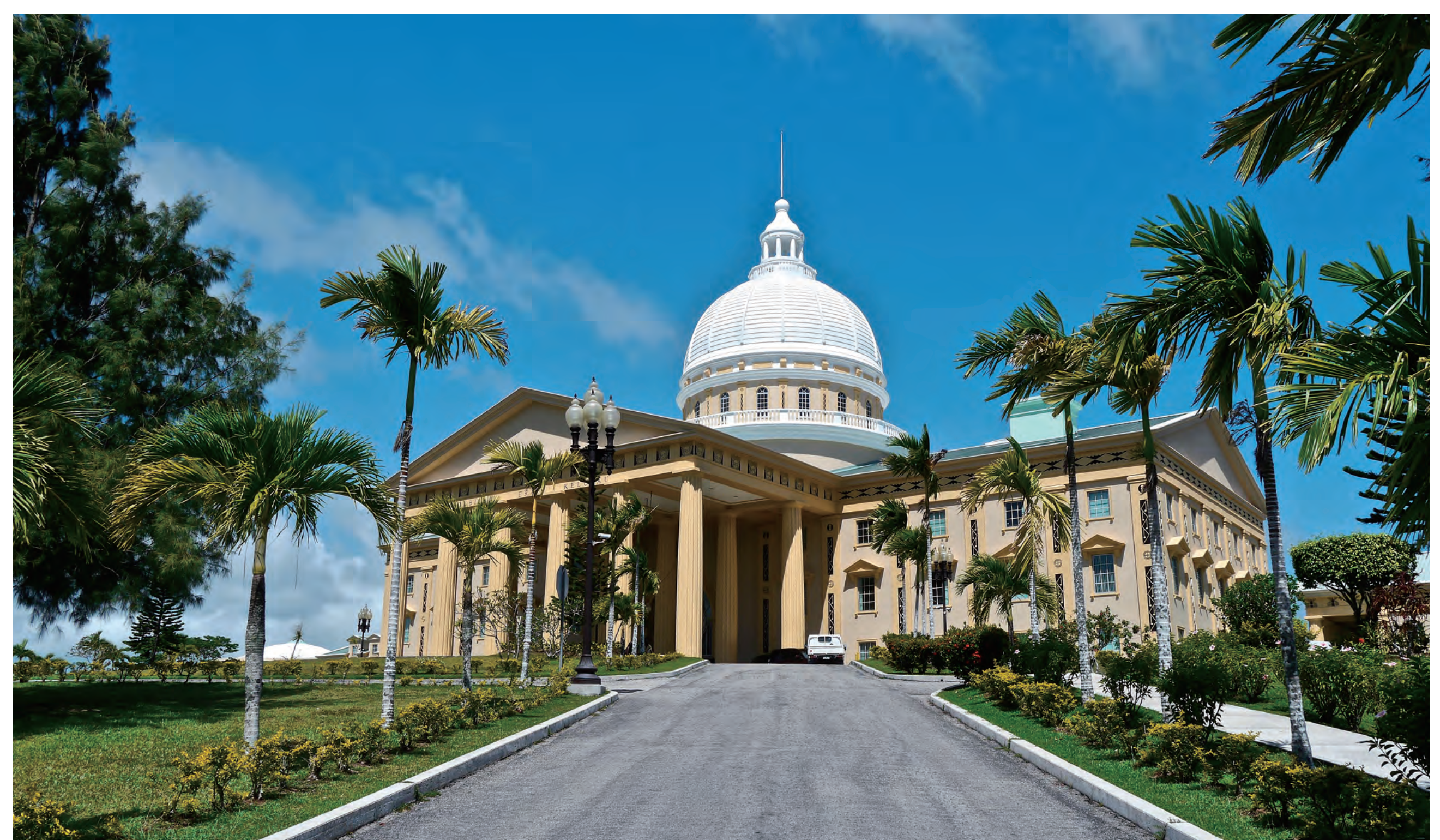
国会議事堂 National Capitol Building