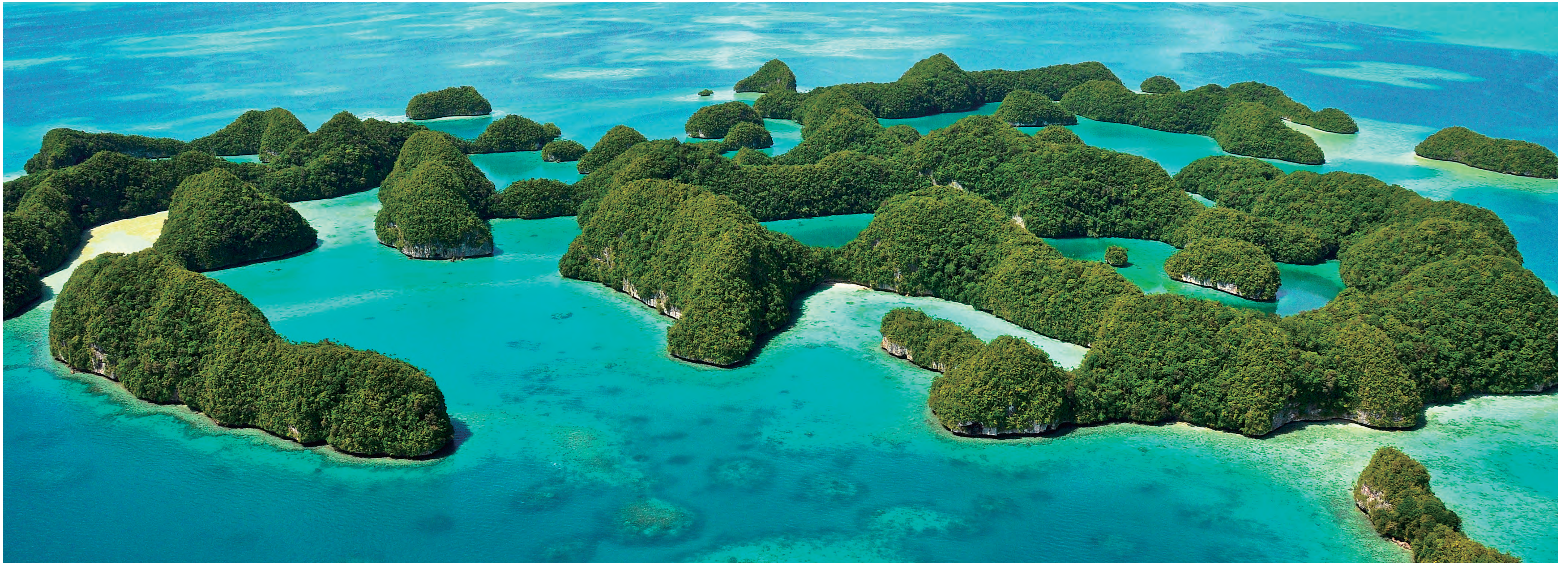
セブンティアイランド Seventy Islands