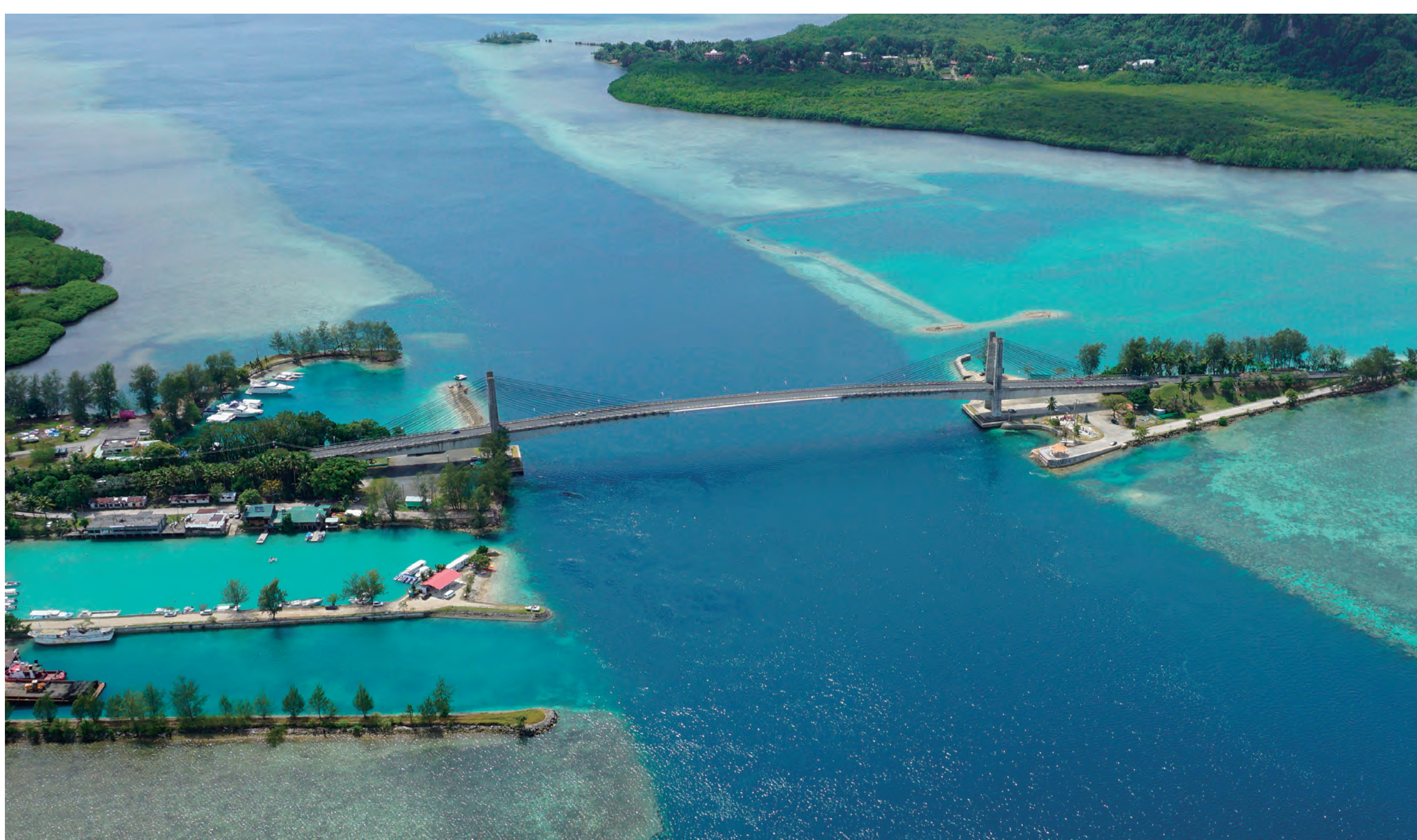
日本・パラオ友好の橋(コロール島) Japan-Palau Friendship Bridge (Koror Island)