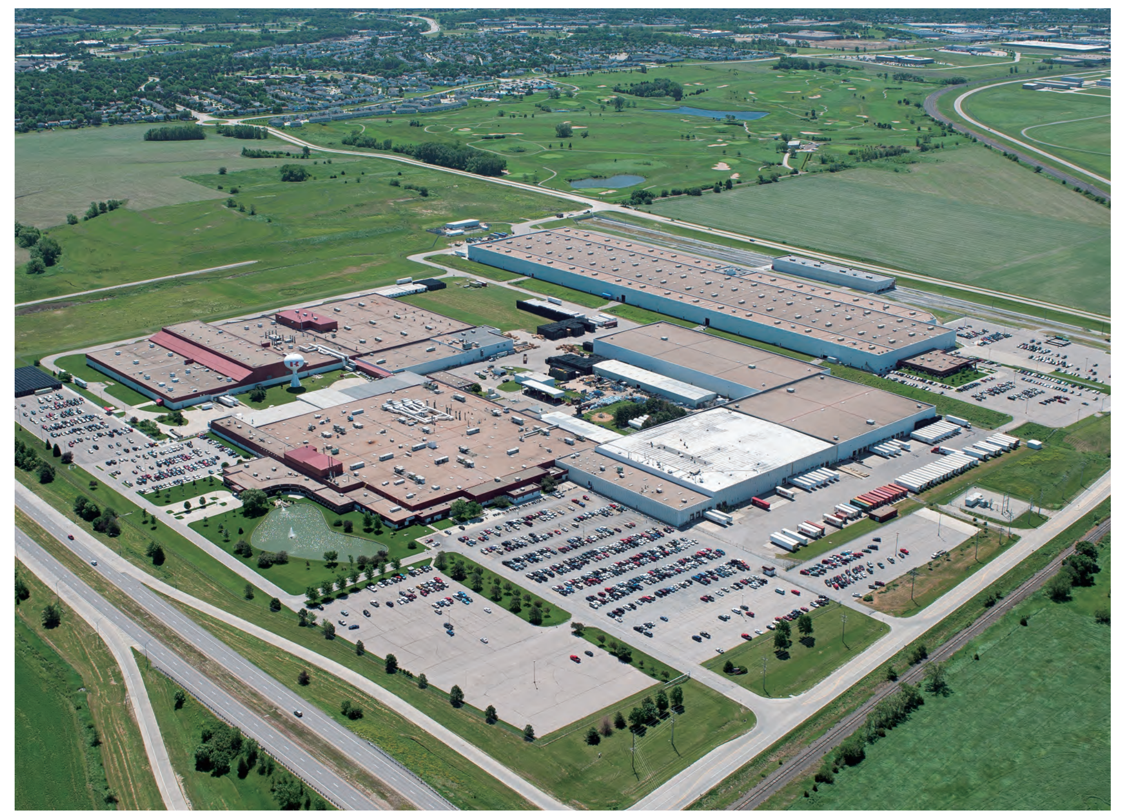
カワサキ・モーターズ・マニュファクチャリング社リンカーン工場 Kawasaki Motors Manufacturing Corp. Lincoln Plant