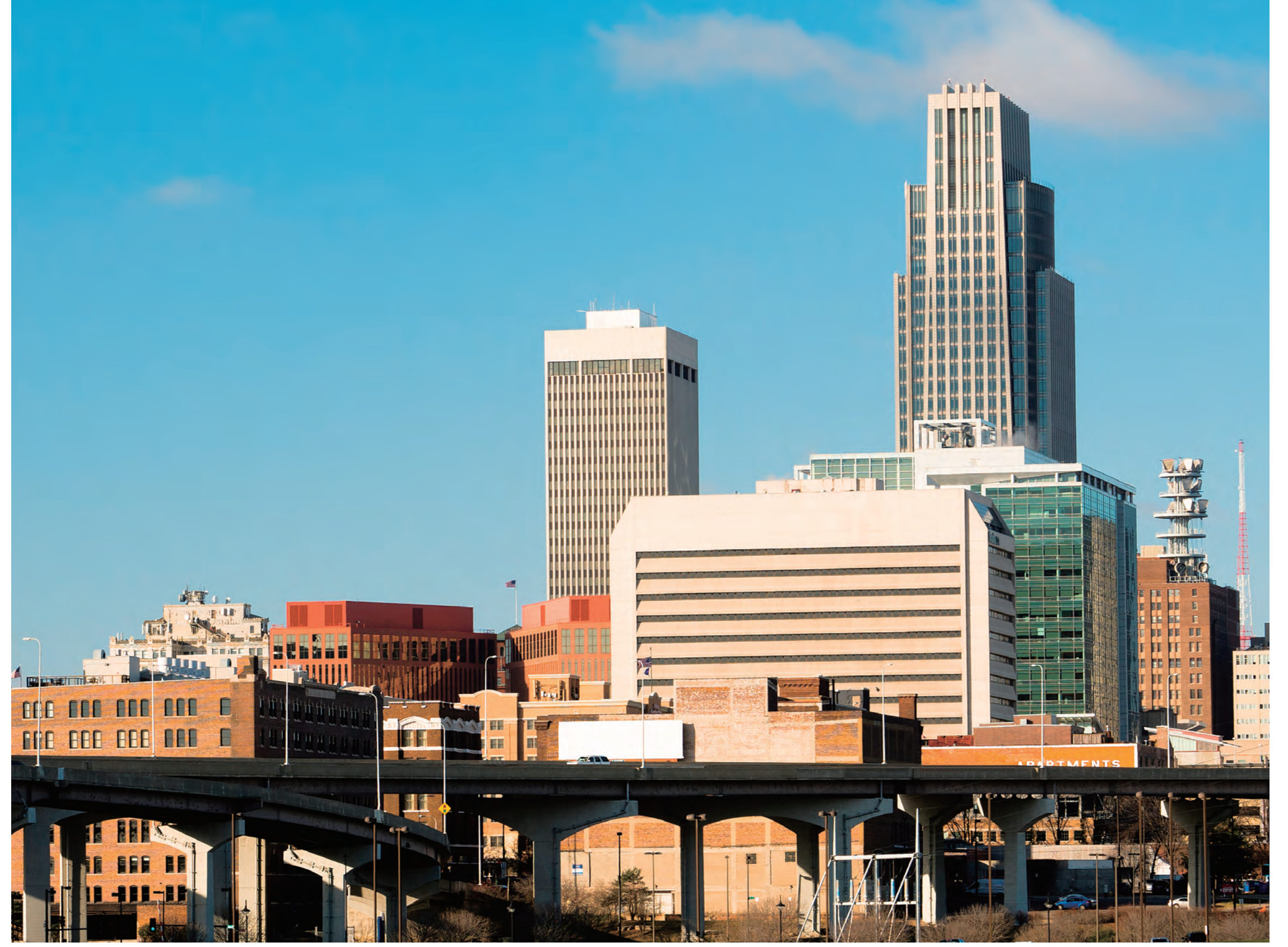
オマハ市街地 Omaha city landscape