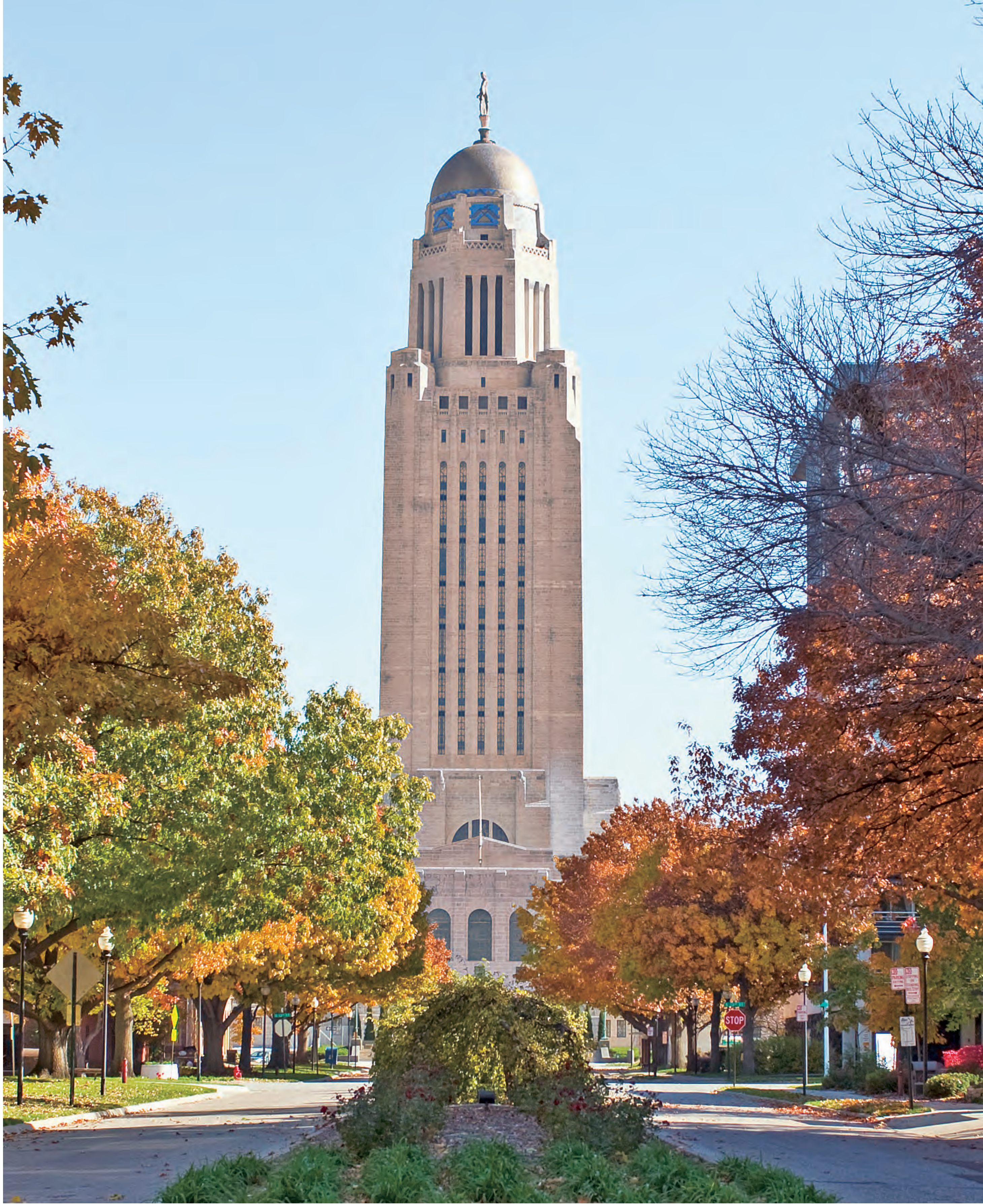
ネブラスカ州会議事堂(リンカーン市) Nebraska State Capitol (Lincoln)