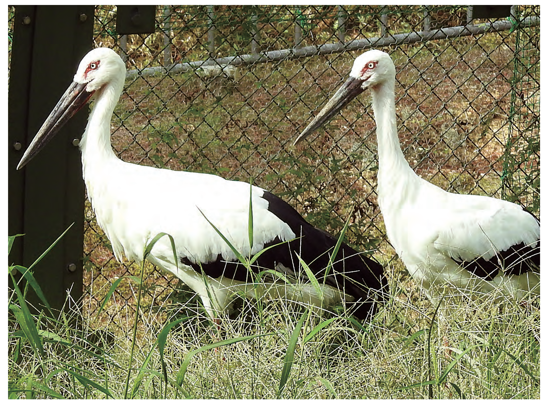
兵庫県に寄贈されたコウノトリのペア A pair of Oriental White Storks donated to Hyogo Prefecture