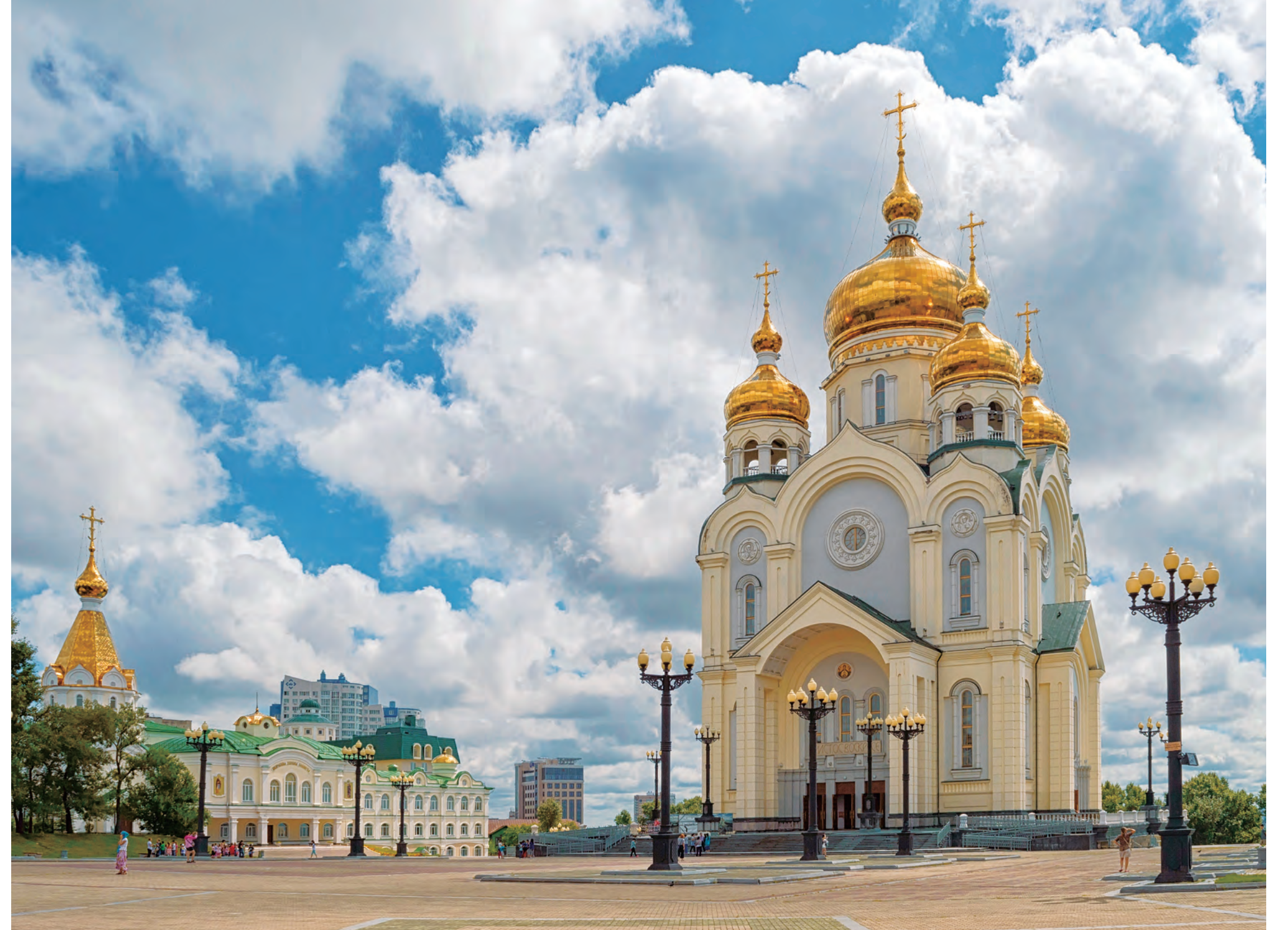
スパン プレオブランジェンスキー大聖堂(ハバロフスク市) Spaso-Preobrazhenskiy Cathedral (Khabarovsk)