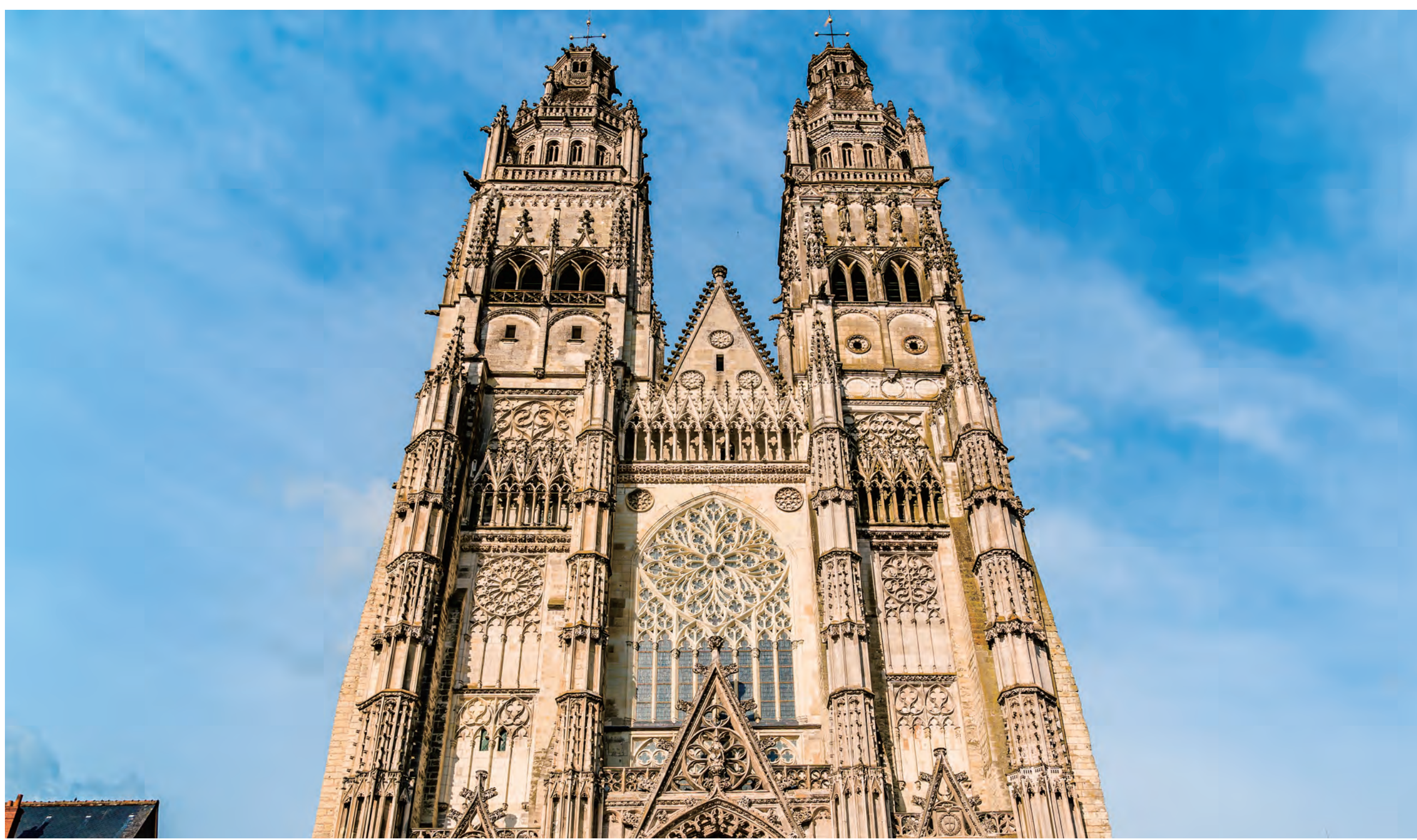
サン＝ガティアン大聖堂(トゥール) St Gatien Cathedral (Tours)