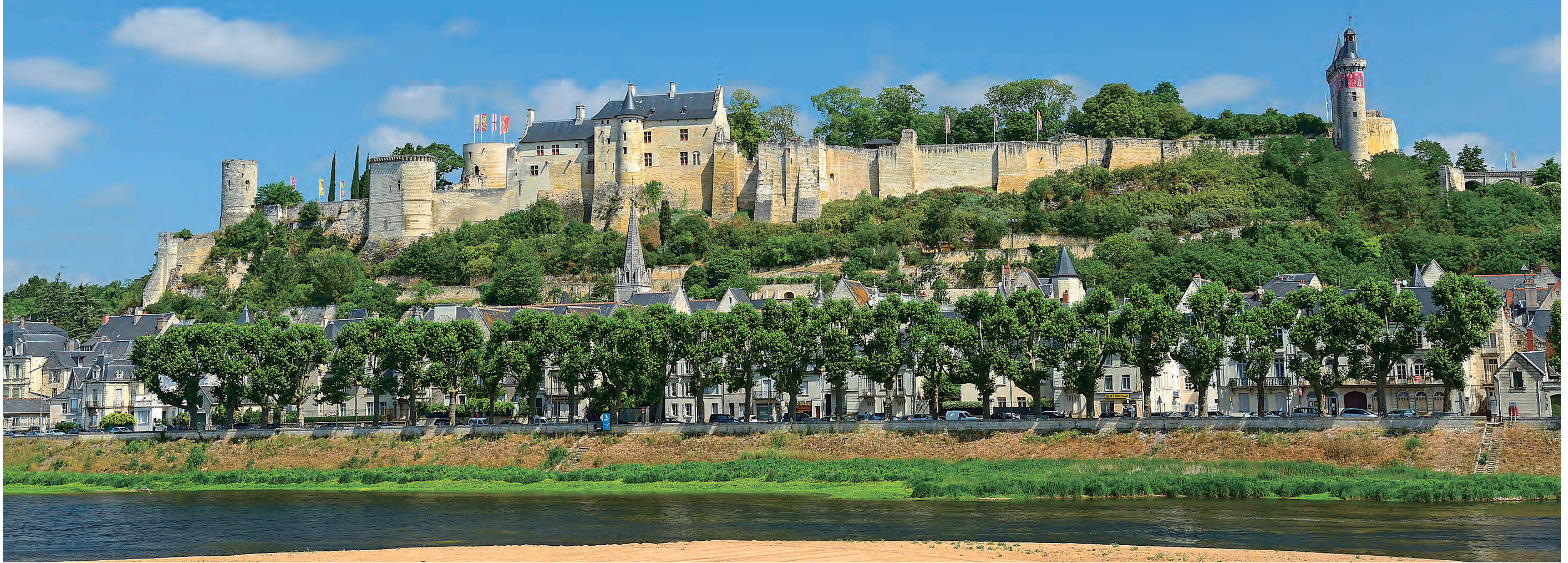
世界遺産の一部であるシノン城 Château de Chinon is registered as a part of a World Heritage site