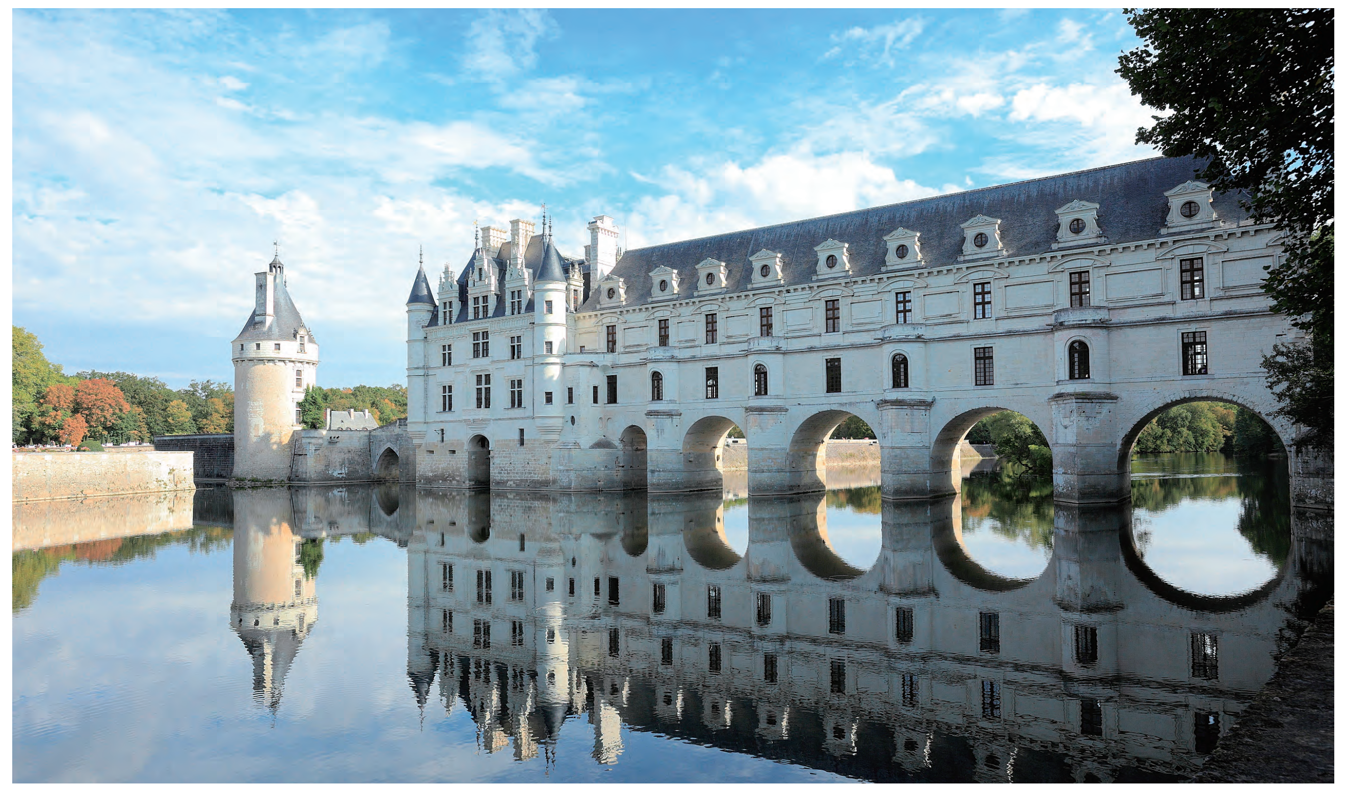
シェール川の上につつシュノンソー城 The Château de Chenonceau on the Cher River