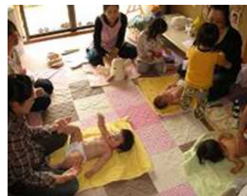
乳幼児子育て応援事業の状況