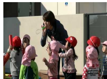
保育士と子どもたち (保育所)

幼稚園、保育所、認定こども園を利用する子どもに対する共通の財政支援として、公定価格から利用者負担額を控除した公費負担額のうち、県費負担分を市町に支弁する。