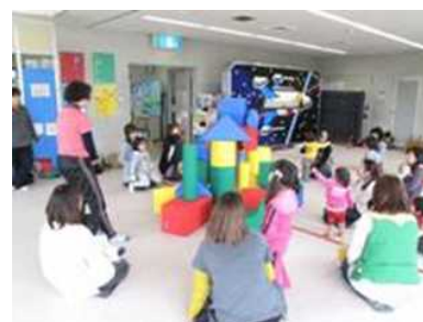
地域子育て支援拠点の状況