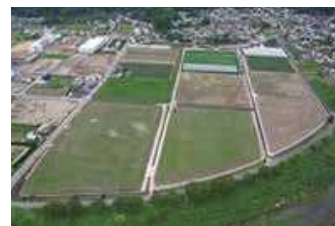
二次整備で大区画化されたほ場 (姫路市)

「農地整備10箇年推進プログラム」に基づき、スマート農業を見据えたほ場の大区画化、ICTを用いた給排水の自動化、水稲に代わる高収益作物導入のための暗渠排水工（農地の排水改良）を推進