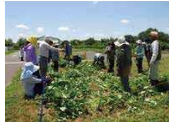
有機農業塾（加西市）

消費者等を対象に、有機農業体験や情報発信等を通じた環境負荷低減や生産の手間等への理解醸成の取組を支援