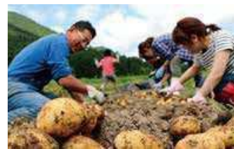
農家によるオープンファームの取組 (丹波市)