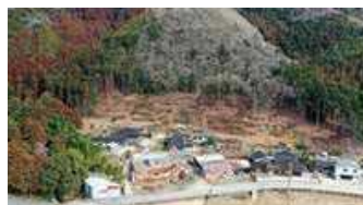
集落裏山の危険木伐採 (宍粟市)

集落裏山にある里山林の山地災害防止機能向上のため、危険木伐採等の森林整備や簡易な防災施設の整備を実施