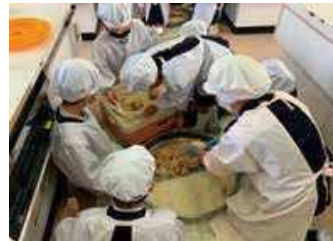
給食用の味噌づくり体験 (太子町)

学校給食での県産食材の利用を推進するため、市町の教育委員会等に対し、アドバイザーを派遣 栄養教諭等の環境負荷低減に対する理解醸成や、有機農産物を継続的に利用する体制構築を推進