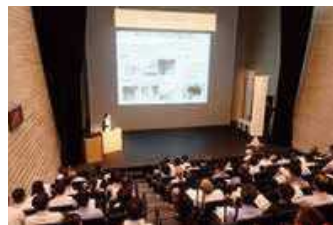
高病原性鳥インフルエンザ 防疫演習 (姫路市)

畜産農家に対し飼養衛生管理指導を徹底するとともに重大家畜伝染病の発生に備え、農場ごとの防疫作業及び焼却処分計画のより実効性の高い内容への更新、埋却処分予定地の現況調査など、防疫対策を強化