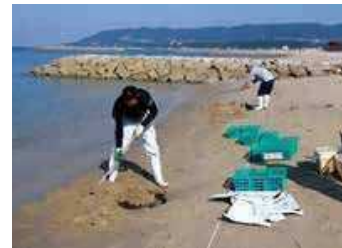
有機肥料による栄養添加試験 (波打ち際への埋設) (淡路市)

播磨地域の流通拠点漁港である妻鹿漁港（県管理第2種漁港）において、衛生管理対策及び陸揚作業の軽労化を目指した屋根付き浮棧橋等を整備