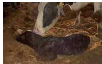
受精卵移植産子と乳用種母牛 (三田市)

飼料生産や家畜堆肥の利用を進めるとともに、必要となる設備・機械の導入を支援し、飼料・肥料の輸入依存度の低減を推進