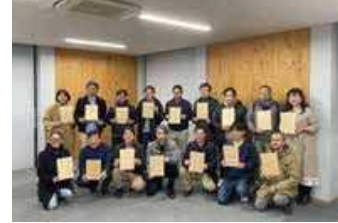
木造建築セミナー修了式 (神戸市)

森林整備による二酸化炭素吸収量をクレジット化し、その収益で森林整備を促進するため、大規模公有林を保有する市町を対象にクレジット発行への取組を支援