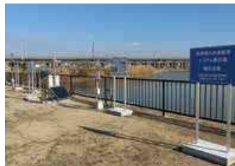
ため池監視システム展示場の開設 (明石市)

ため池の治水活用による減災対策やハザードマップによる避難対策のほか、監視体制を強化するため水位等の遠隔監視システムの導入などICTの活用を推進