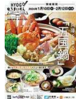
外食チェーン店における 県産食材を活用したフェア

海外における日本食人気の広がり等を好機と捉え、県産農林水産物の輸出拡大が期待される国でのプロモーションの実施、EU（フランス）での食品展示会への出展など販路拡大を推進