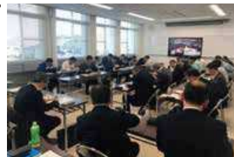
米卸売業者とのオリジナル品種試食意見交換会（加西市）

日本酒の有機JAS認証制度の開始を踏まえ、有機等こだわりの日本酒生産を推進 輸出促進セミナーや海外バイヤーとの商談会開催のほか、輸出向け日本酒の商品開発やコンテスト出品等への支援により、国内外に県産酒米と日本酒の魅力を発信