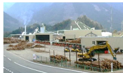
(協)兵庫木材センター (宍粟市)