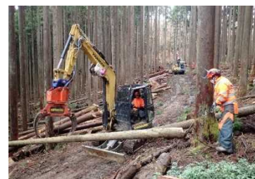
県立森林大学校生の機械実習 (神河町)