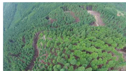
路網を整備した原木供給団地 (宍粟市)

また、「第3期ひょうご林内路網1,000km整備プラン」(計画期間：R1～R5)に基づき、団地内での路網整備を推進し、令和4年度末の路網延長(累計)は、3,348kmとなった。