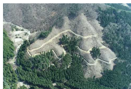
主伐・再造林地 (朝来市)

また、主伐・再造林の低コスト普及モデルを構築するため、作業工程ごとのコスト分析を行った結果、収益性の高い施業地では、共通する条件として、①haあたり搬出材積600 m 3 以上、②林内運搬距離(土場まで)1,000m以下などが明らかになってきた。この成果は森林組合や関係団体による「主伐・再造林推進協議会」において、情報共有を行った。