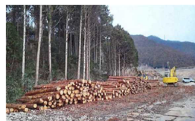
バイオマスヤードに集積された燃料用材 (多可町)

令和 2 年度以降 11 カ所が新たに整備され、4 年度までに約 2.5 万 m^3 の木材搬出に活用された。