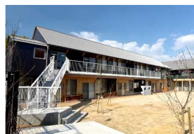
神戸市立鈴蘭台西町保育所 (神戸市)

木造・木質化に取り組む神戸市他8市町に対し、「ひょうご森づくりサポートセンター」から専門のアドバイザーを派遣するなど、28回の建築設計支援を実施した。しかし、コロナ禍での経済活動の停滞や、その後の資材価格高騰等の影響に起因する新規着工数の減少により、令和4年度に竣工した県・市町の公共施設のうち、木造施設は6施設、木質化施設は27施設、県産木材使用量は629m 3 に留まり、前年度から大幅に減少した。