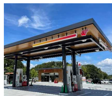
スマートエコステーション 鹿の子台店（神戸市）