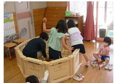
木製玩具を使った木育キャラバンの様子(宍粟市)

幼児の頃から、木製玩具や遊具に触れて、木の良さを感じ親しんでもらうため、保育所・幼稚園へ木育アドバイザーを派遣するほか、木製玩具を貸与するなどの木育キャラバンを実施した（43回開催、参加者2,827名）。