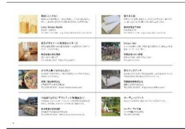
ひょうご木製品マイスターの取扱製品を紹介したカタログ