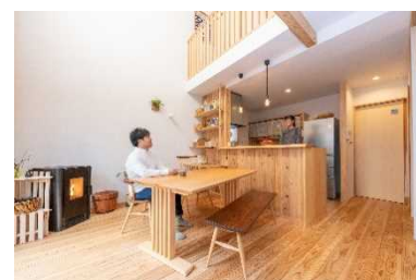
県産木材の魅力を活かした木造住宅 (神戸市)

さらに同工務店が参集した「ひょうご木の匠の会」では、住宅展示・相談会を開催(神戸市ほか12市町42回)し、県民へのPR活動を行うほか、県産木材の利用に興味はあるものの、利用した経験のない工務店等に対して、木材市場や製材工場の現地見学会を開催(2回開催、参加者：44名)し、利用意識の醸成を図った。