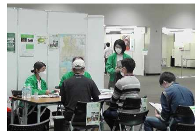
森林の仕事ガイダンス (大阪市)

さらに、就業前に知識や技能を身につける林業就業支援講習(参加者：10名)を実施し、新規の林業就業者54名を確保した。