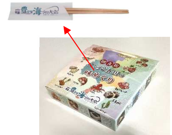
ひょうご五国の味めぐり弁当と県産木材製スギ割り箸

また、令和5年7月からのJR兵庫デスティネーションキャンペーンにおいても、協賛企業の駅弁に県産木材製スギ割り箸の採用を呼びかけ、県産木材の利用を進めている。