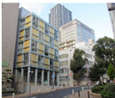
兵庫県林業会館 （神戸市）

近年、県内のCLT建築物は、着実に増加しており、令和5年6月末時点でCLTが部分的に使用されたものも含め23施設が建築され、令和4年度には出光興産株式会社によって神戸市内にCLTを使用した環境配慮型サービスステーションも開所されている。