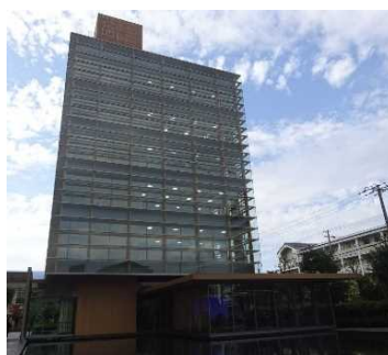
タクマビル新館 （尼崎市）