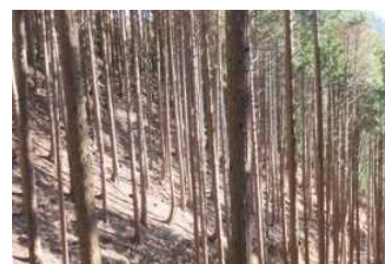
森林環境譲与税を活用した条件不利地の間伐（丹波市）

県では、市町による同税の積極的な活用に向け、①技術的支援や助言を行う「ひょうご森づくりサポートセンター」の設置、②県立森林大学校での市町職員対象の研修講座等を実施している。