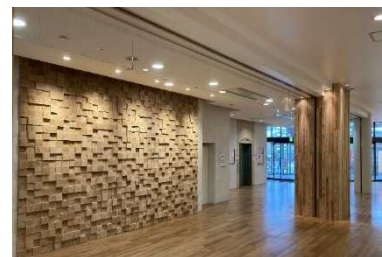
キッピーモール（木質化） （三田市）

木質化等整備のモデルとして、多くの県民の利用が見込める施設や、公益性の高い施設での県産木材を使った木質化や木製品導入をすすめるため、令和4年度は三田市のショッピングモール他5カ所において木質化や木製品導入を支援した。