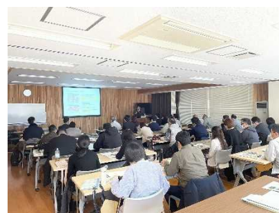
建築士養成セミナー （イメージ）

公共施設をはじめ非住宅建築物の木造化を進めるには、木造に関する知識を持った建築士が施主に対して木造を提案することが重要であるが、知識を持った建築士の数は、現状では不足している。そこで令和5年度から、木造設計に関する実践的な知識・技術を習得できるセミナーを開催し、非住宅建築物の木造設計に精通し、かつ木材供給事業者等とのネットワークを持った建築士の育成をめざす。