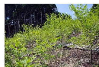
針葉樹林と広葉樹林の混交整備 [広葉樹植栽4年後]（宍粟市）

大面積に広がる高齢人工林を部分伐採した跡地にコナラ等の広葉樹を植栽する「針葉樹林と広葉樹林の混交整備」の実施等により、災害に強く、森林から海への栄養塩等の供給を促すなど、多様な森林への誘導を図った。