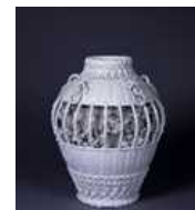
白磁籠目菊花貼付壺 明治30年代(1897~1906) 兵庫陶芸美術館(田中寛コレクション)

「雪よりも白い」と表現される白磁が特徴的な出石焼、江戸時代後期に創業した兵庫県内の多くの窯場が廃窯していく中で、さまざまな困難を乗り越え、今もやきものづくりが続けられています。本展では当館の所蔵品に加え、各地の博物館や美術館、個人が所蔵されている優品を一堂に会し、その歴史や技法などを紹介します。