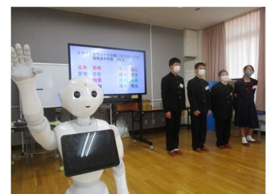
Pepperを使った授業風景(天満東小)

【問い合わせ先】東播磨県民局総務企画室総務防災課(企画防災担当) TEL079-421-9016