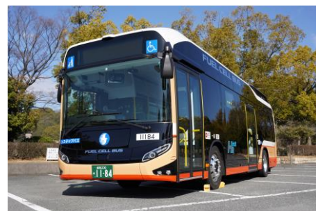
燃料電池バス（神姫バス）