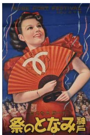
ポスター(神戸みなとの祭)1936 年 兵庫県立歴史博物館蔵 (入江コレクション)