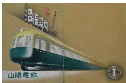
「山陽鉄道沿線案内」1940 年 兵庫県立歴史博物館蔵