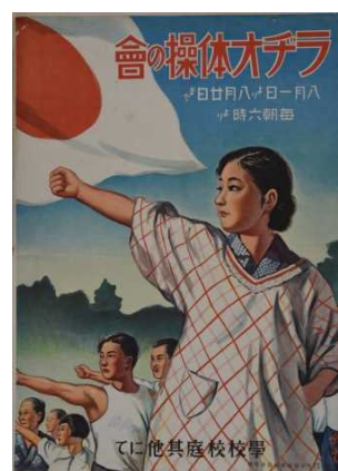
ポスター(ラヂオ体操の会) 昭和期 兵庫県立歴史博物館蔵(高橋コレクション)