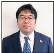
消費者庁審議官 (新未来創造戦略本部次長)

https://tedxkobe.com/speaker/speaker0057/