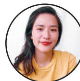
環境活動家 露木 志奈氏