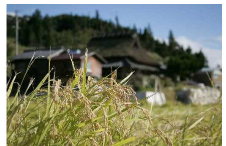
兵庫の特産「山田錦」

(URL: http://web.pref.hyogo.lg.jp/nk12/sakamaicam.html )