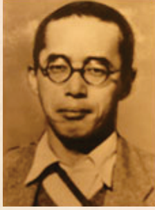
しまだ あきら 島田 叡氏

明治34年(1901年)12月25日、兵庫県神戸市須磨区に生まれる。昭和20年1月、最後の官選知事として、米軍上陸が間近に迫る沖縄県に赴任。常に沖縄県民に寄り添い、食糧の調達や県民の疎開などに尽力し、同年6月、糸満市の摩文仁の丘で消息を絶った。戦後、「沖縄の島守」と称され、今なお多くの人々に慕われ続けている。