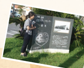
新温泉町での交流活動