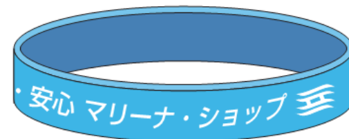
指導や啓発を行った水上オートバイユーザーに配布するリストバンド