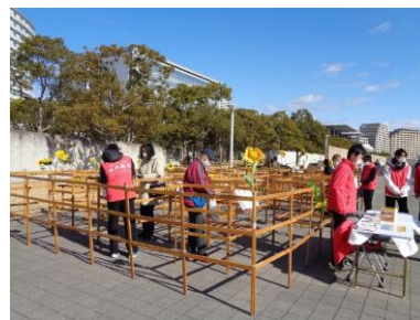
交流ひろば（防災楽習迷路）