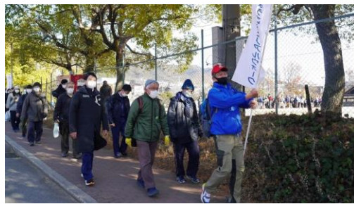
メモリアルウォーク