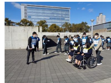
要支援者等避難誘導訓練