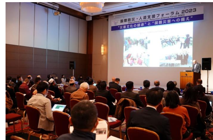
国際防災・人道支援フォーラム