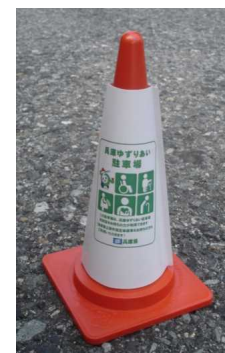
【駐車場での設置例】