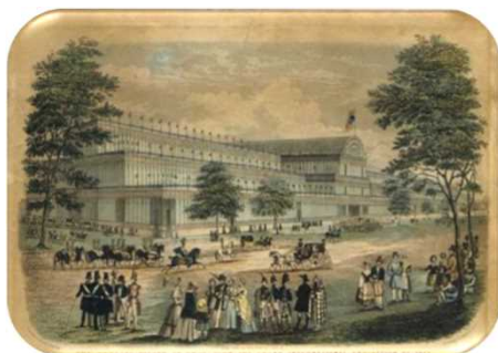
世界初の万国博覧会 ロンドン万博 銅版画

万博の歴史や意義をふりかえるとともに、兵庫県で開催された博覧会や大阪万博(EXPO'70)の様子・出来事を映像等で紹介