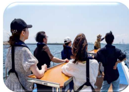
大学生による現地体験ツアー 「尼崎運河クルーズツアー」

「ひょうごフィールドパビリオン」の魅力を映像・ワークショップ・大学生による現地体験ツアーの報告等により発信