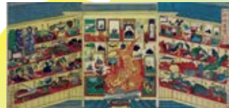
湯島聖堂博覧会(文部省博覧会)1872年 古今珍物集覧 元昌平坂聖堂ニ於テ 三枚続