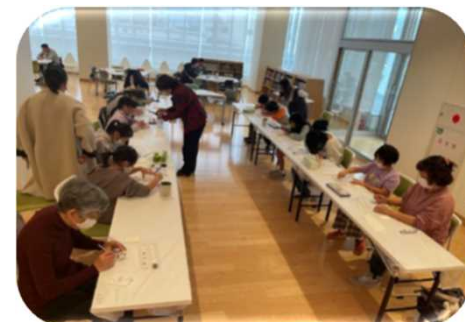
ひょうごフィールドパビリオン ワークショップの様子