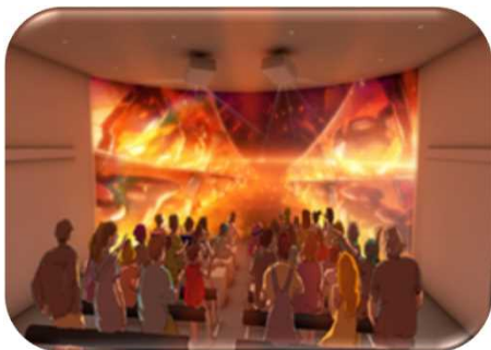
兵庫県ゾーン“ミライバス”