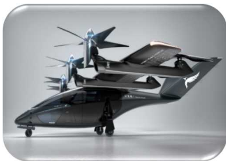
空飛ぶクルマの模型展示 (W1.5m×D1.3m×H0.4m)