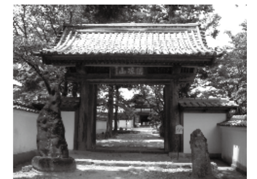
九鬼家、白洲家菩提寺・清涼山 心月院