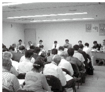
グループ編成の様子

各グループの紹介や、活動計画は4・5頁をご覧ください。さらに、県民の皆さんとビジョン委員が一緒になって地域の夢や将来像を語り合う「地域夢会議」、また、各地で繰り広げられている活動の事例や、地域の歴史文化や産業の魅力をご紹介する「地域見本市」の開催も予定しています。皆さんのご参加をお待ちしています。