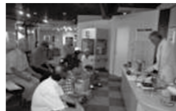
水の博物館にて 理科実験

9月に水の科学博物館を訪問し、水の不思議を体感しました。秋には武庫川水系の峡谷を探訪し、自然景観を観察します。