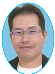
第9期阪神北地域 ビジョン委員会 委員長