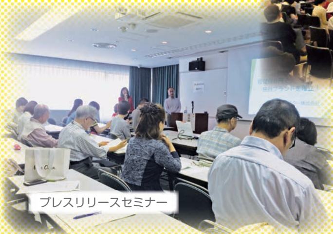
プレスリリースセミナー