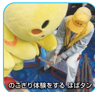
のこぎり体験をする はばタン