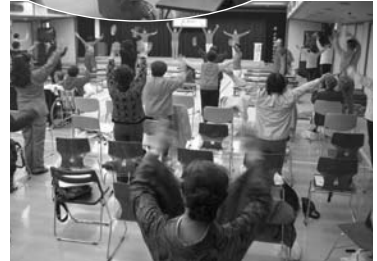
伊丹大道芸サークルの南京玉すだれ

皿回しの妙技では、ヒヤヒヤしながらもはじめて見た方も多く、感動されていました。特に皿回しの体験コーナーでは、目の不自由な方や車椅子の方たち、また子供さんにも挑戦してもらい、うまく回った際には、観客から拍手喝さいを浴びました。