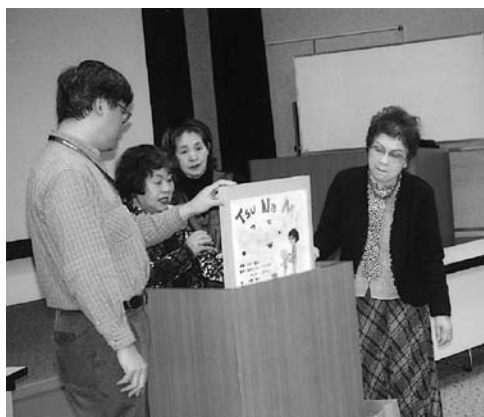
▲ビジョンパートナーによる活動発表

すでに私たち第三期ビジョン委員会は、十一の活動グループと広報部に分かれ活発にグループ活動を展開していますが、さらに十八年度は、各グループの活動がより大きな広がり