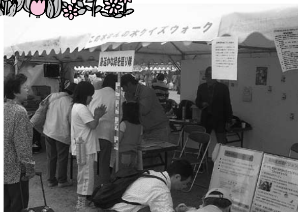
▲ビジョン委員会の活動紹介パネルを展示

のポットをプレゼントしました。当日は天候にも恵まれ、二日間で合計九十二組、約二百人の方々に参加して頂き、大盛況のうちを終了することができました。クイズウォークの受付時には、今回のクイズウォークが、ビジョン委員会の活動の一つであることを参加者に説明するとともに、ブース内にビジョン委員会のパネルを展示し、活動内容について理解を深めて頂くように努めました。多くの市民の方々に身近な緑に親しんで頂くことが出来た二日間になったと思っております。