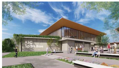
▲KSC Spark Base