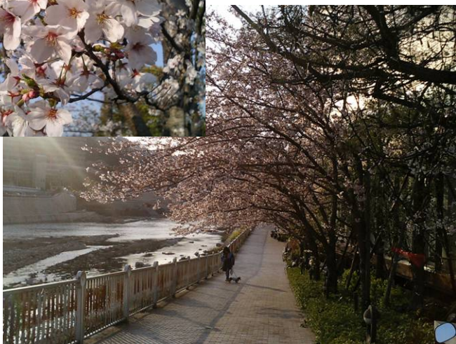
武庫川沿川の桜(宝塚市内)