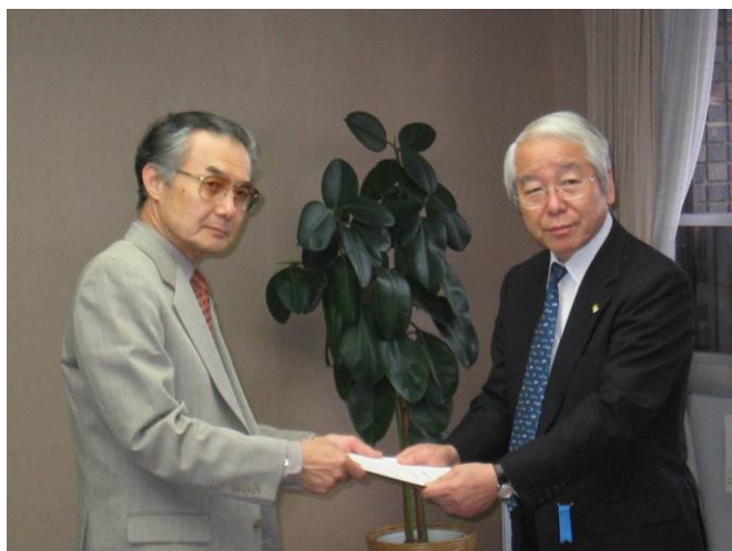
井戸知事への報告(平成18年4月11日)