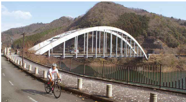
知明湖（一庫ダム）付近