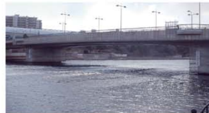
【県道芦屋鳴尾浜線 夙川橋(芦屋市)】