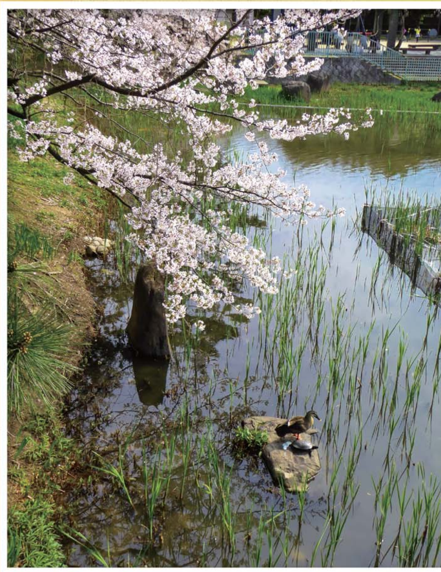
「あにあん」フォトコンテスト2020 金賞(西宮市)「仲良しの春」西澤忠雄様 兵庫県阪神南県民センター 西宮土木・尼崎港管理事務所