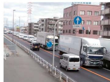
【尼崎宝塚線(尼崎市) [渋滞状況]】