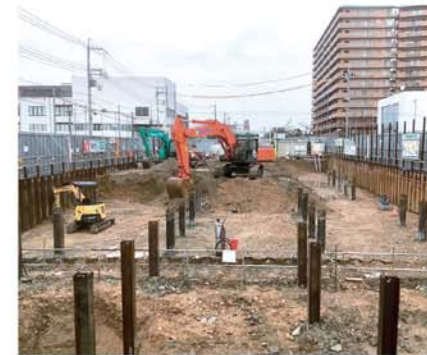
【園田西武庫線[御園工区] (尼崎市)】