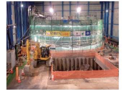
【津門川地下貯留管立坑構築中】