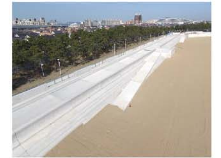
【南芦屋浜地区 ビーチ護岸(芦屋市)】