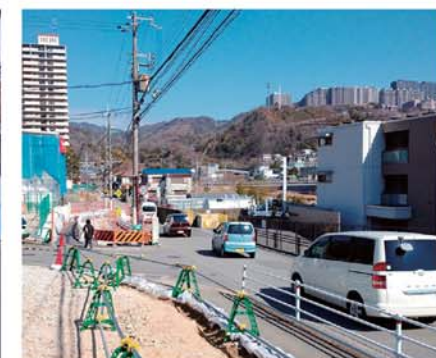
【県道生瀬門戸荘線(西宮市)】