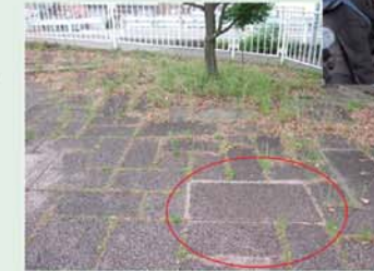
【施工箇所】 (西宮市東川親水南公園)