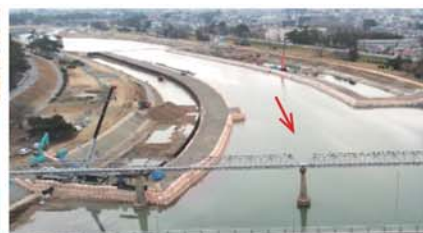
【武庫川 護岸工事 旧国道上流】