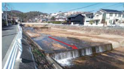
【仁川 堆積土砂撤去工事】