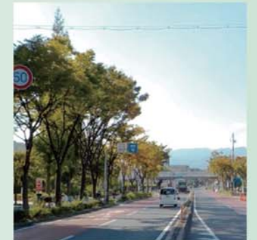
【まちなみ景観になじむ街路樹(ケヤキ)】

街路樹管理の課題や工夫などを情報共有する連絡会を開催し、方策の検討や連携した取組を推進