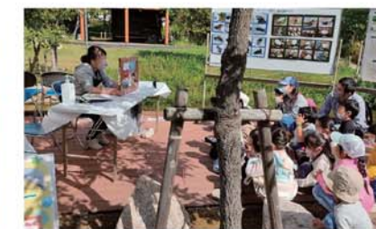
【尼崎の森中央緑地森のフェスタ】