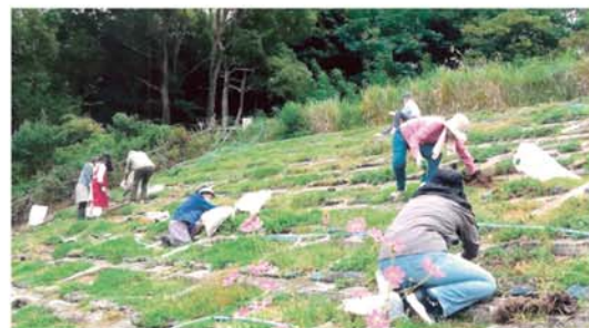
【ひょうごアドプト(西宮市)】

「ひょうごアドプト」など、地域住民が主体となって草刈り等の簡易な維持管理や美化活動を推進