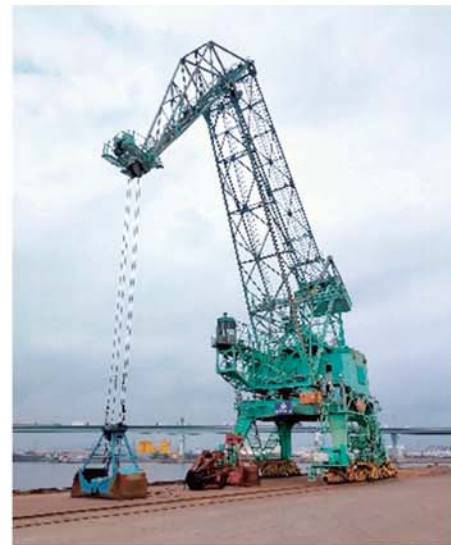
【東海岸町地区(尼崎市)現況クレーン】