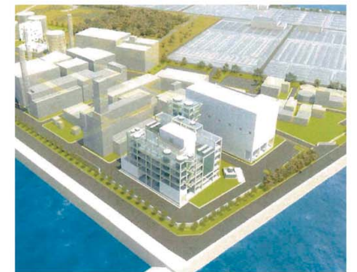
【兵庫東流域下水汚泥広域処理場 [尼崎市] 下水汚泥エネルギー有効利用施設整備完成パース】