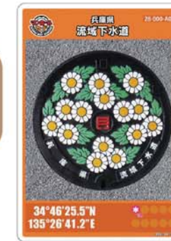
【マンホールカード】