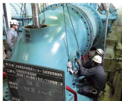
【東浜第2排水機場(尼崎市)ポンプ分解整備】