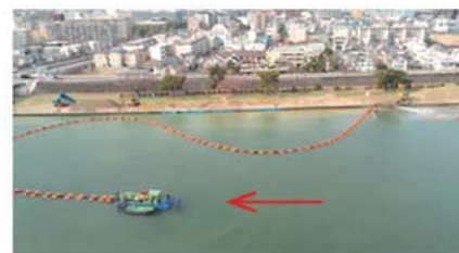
【武庫川 河床掘削工事 臨港線上流】