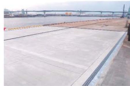
【東海岸町地区(尼崎市)-10m岸壁改良】