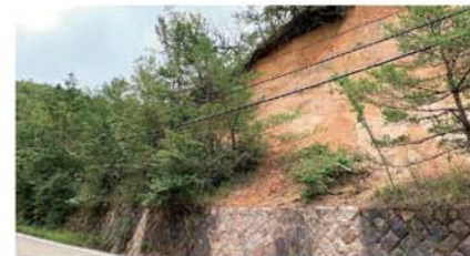
【県道宝塚唐櫃線(西宮市)】