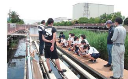
【尼崎運河オープンチャネルデイ】