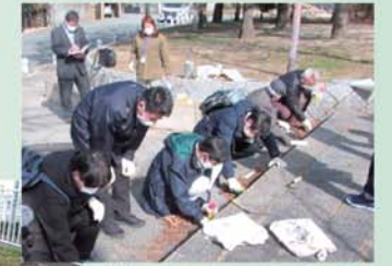
【住民参加による除草】