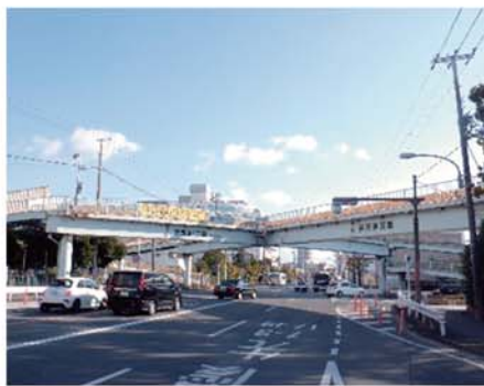
【県道米谷昆陽尼崎線 芦原歩道橋 (尼崎市) 塗装塗替等】