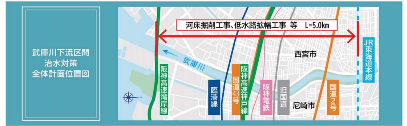
【武庫川下流区間 治水対策全体計画位置図】