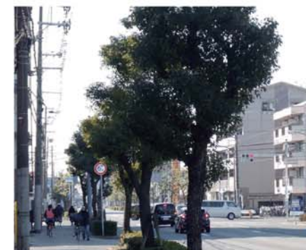
【県道大阪伊丹線(尼崎市)】