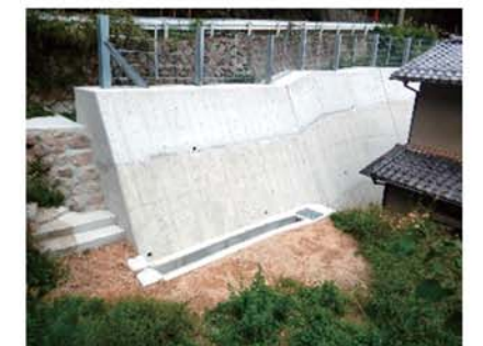
【船坂(4)I地区山腹工事(西宮市)】(R2年度)