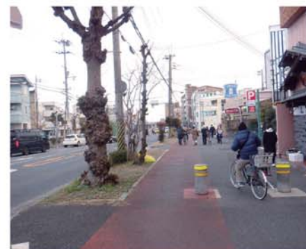
【県道甲子園六湛寺線(西宮市)】