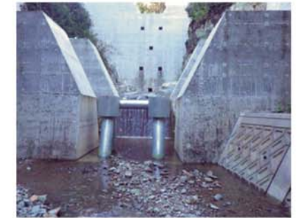
【墓ヶ谷川砂防堰堤(西宮市)】(R3年度)