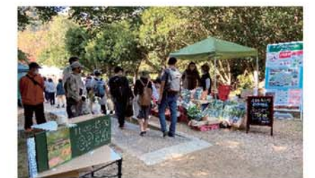
【甲山森林公園マルシェイベント】