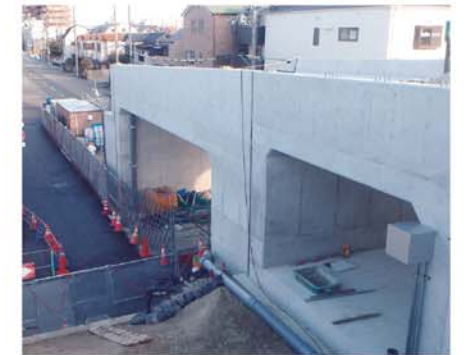
【園田西武庫線[藻川工区] (尼崎市)】