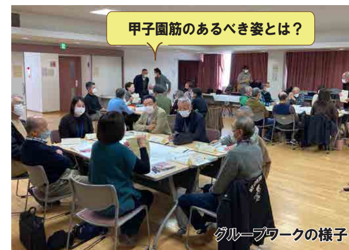
甲子園筋のあるべき姿とは？