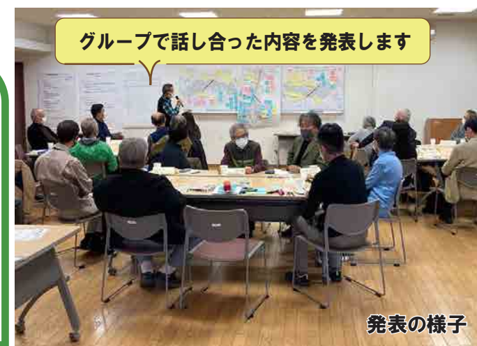
グループで話し合った内容を発表します