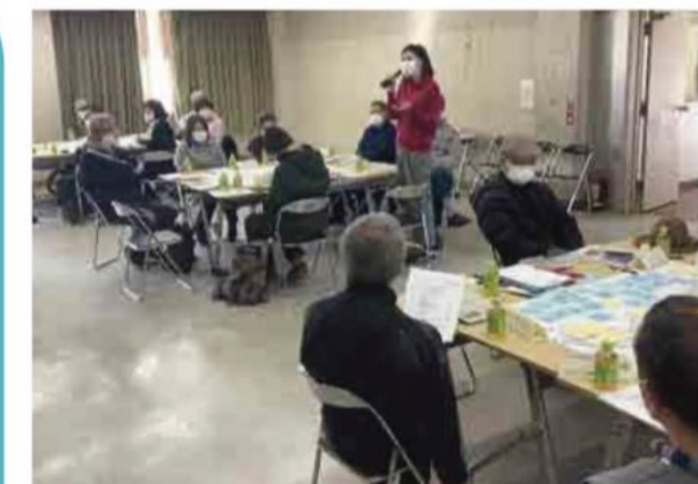
グループで話し合った内容を発表しました