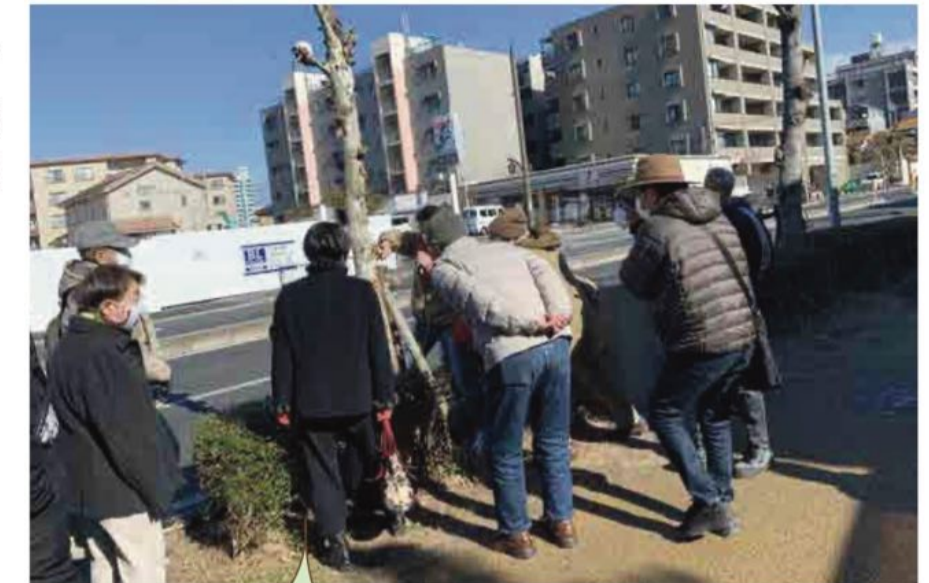
プラタナスの木に、カミキリムシが入り、上部が枯れている様子を確認しました