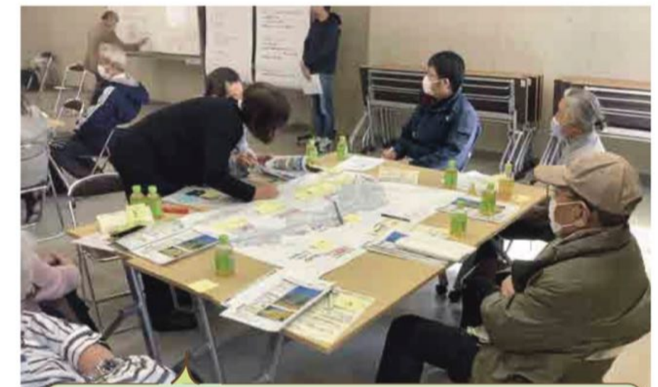
現地見学で気づいたことをグループでまとめました

最後に、グループで話し合った内容を発表し、各グループから出された質問については、樹木医から回答があり、全員で共有しました。