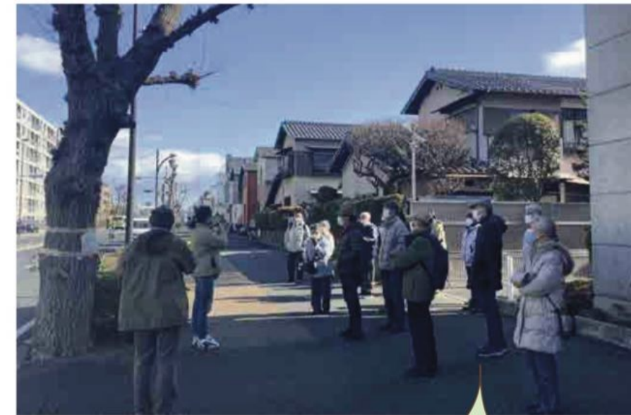
ポプラの木の特徴や現在の状態について樹木医より説明を受けました

第2回目のワークショップでは、参加者全員で甲子園筋に行き、樹木医から街路樹の現状について説明を受けました。樹木の特徴や害虫被害、樹勢等についての説明があり、参加者の皆さんは熱心に耳を傾けていました。