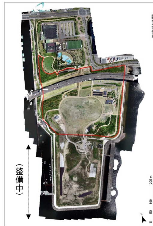
申請区域:朱線で囲んだ部分