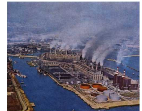
かつての尼崎臨海工業地帯 (兵庫県発行絵はがき、S39年頃)