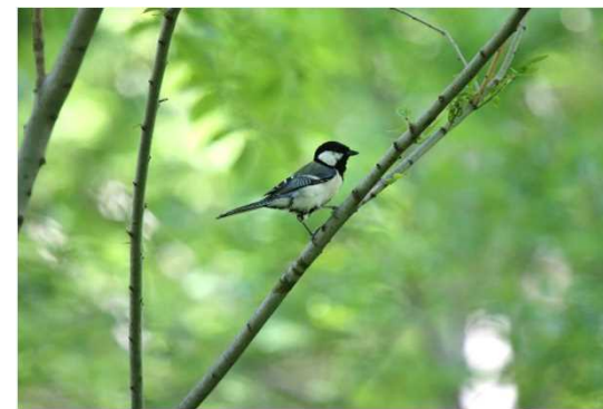
シジュウカラ（在来種）