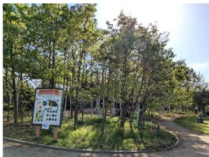
植栽から17年が経過したコナラ-アベマキ林