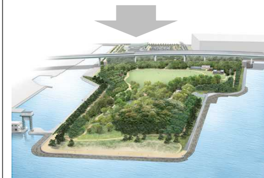
将来像 (全体イメージ)