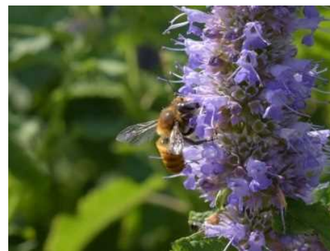
キバラハキリバチ *環境省レッドリスト準絶滅危惧種