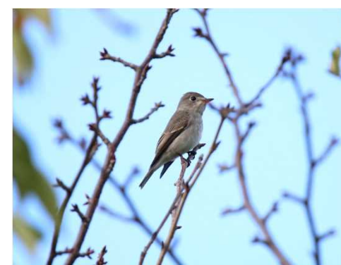
コサメビタキ *兵庫県レッドリストランクC