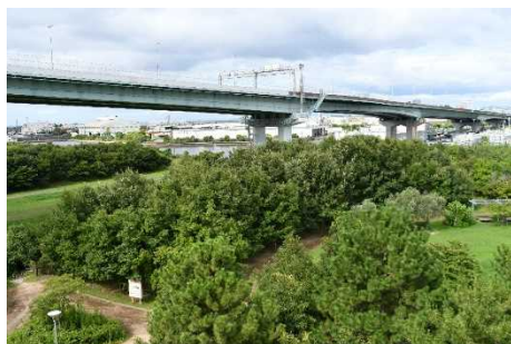
上空から見た植栽17年目のコナラ-アベマキ林