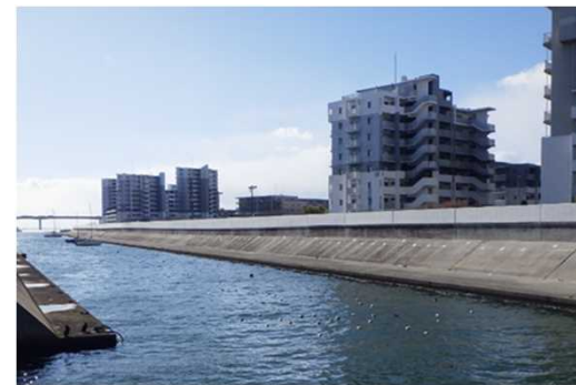
防潮堤嵩上げ(枝川町地区)