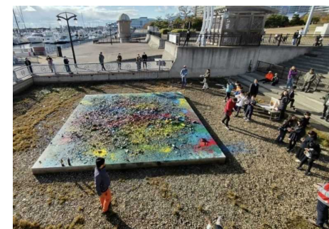
100年続けるアート「平和の証」 瓶投げアート公開制作