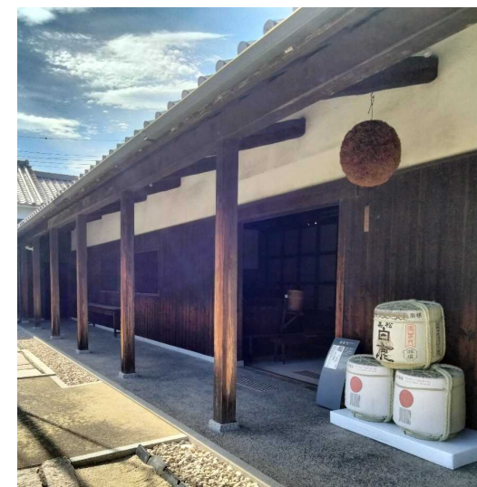
白鹿記念酒造博物館(西宮市)