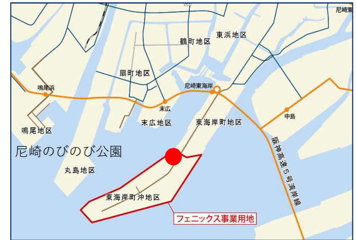
尼崎のびのび公園 位置図