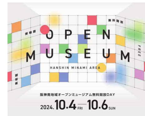
オープンミュージアム無料開放DAYキービジュアル