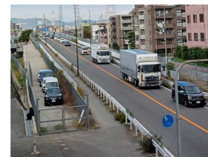
尼崎宝塚線(阪急立体工区)