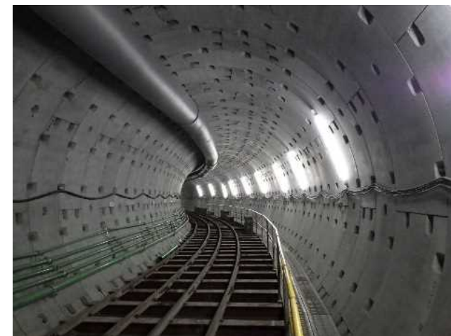
津門川地下貯留管(貯留管内部)