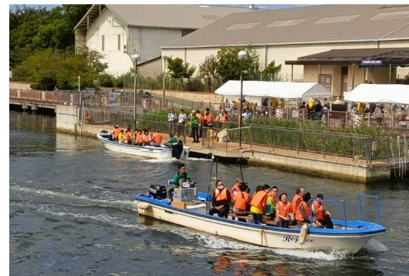
尼崎運河魅力アップ(クルーズ)