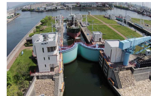
尼崎閘門(尼ロック)