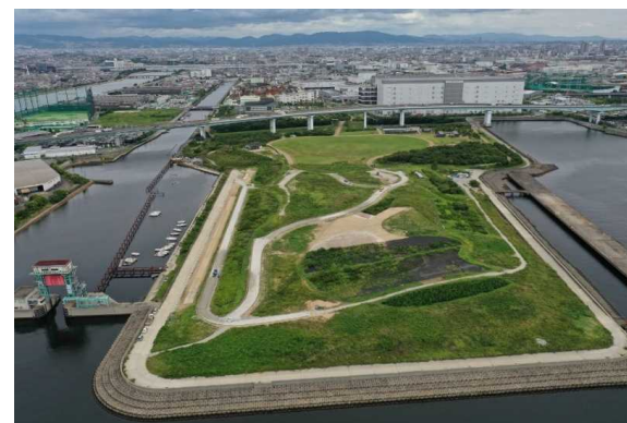
尼崎21世紀の森中央緑地