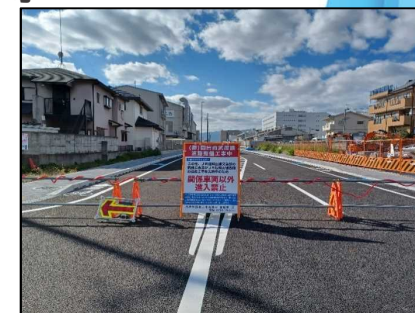
園田西武庫線(御園工区)