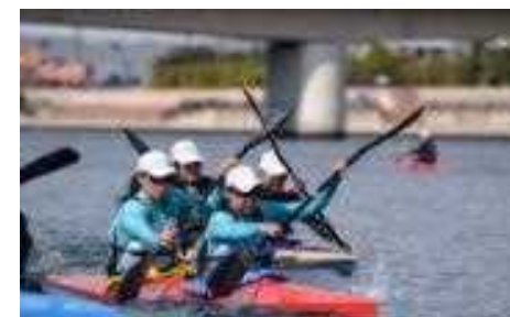
兵庫県立海洋体育館前(芦屋市)