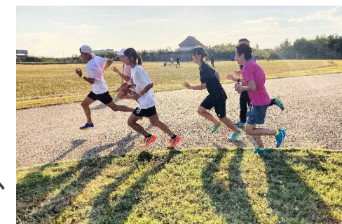
アスリートによるランニング教室