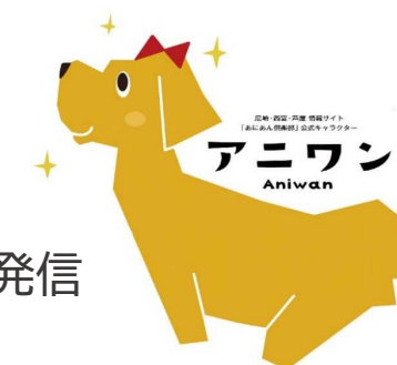
あにあん倶楽部「アニワン」