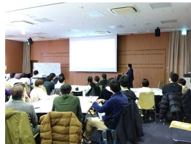
多職種連携フォーラムでのグループワーク