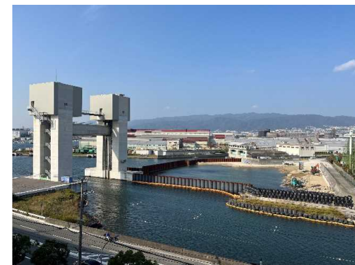
新・新川水門、新川・東川統合排水機場