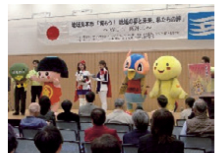
地域見本市の開催風景

阪神北地域の魅力の再発見を通じて地域への愛着を深めるとともに、地域課題に主体的に対応する活動の担い手を発掘することを目的として、ビジョン委員自らが企画し、地域団体等を中心に日頃の活動を広く発表する「地域見本市」を開催する。