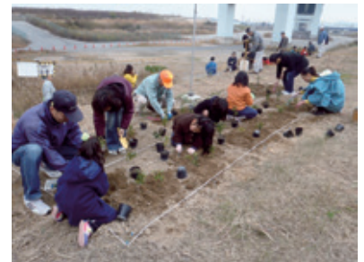
尼崎21世紀の森づくり

対象エリアは、国道43号以南の約1000haで、市民、企業、各種団体、行政等あらゆる主体の参画と協働による森づくりを推進しています。