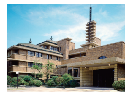
甲子園会館(旧甲子園ホテル)