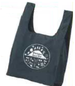
甲山森林公園オリジナルエコバック