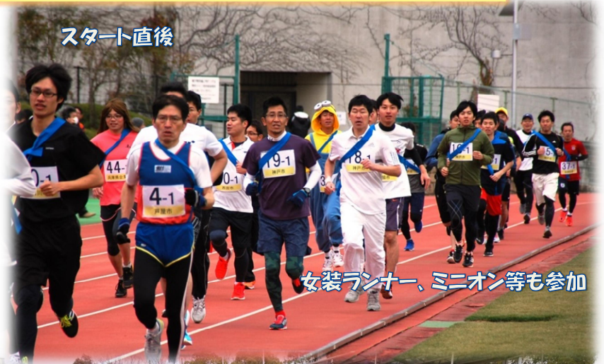
女装ランナー、ミニオン等も参加