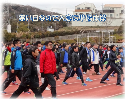
寒い日なので入念に準備体操