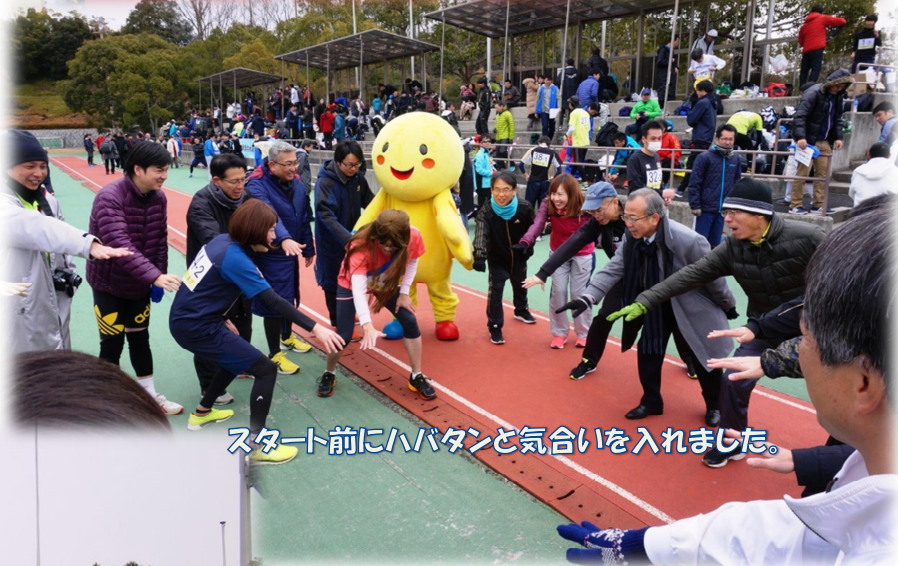
スタート前にハバタンと気合いを入れました。