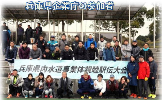
兵庫県企業庁の参加者