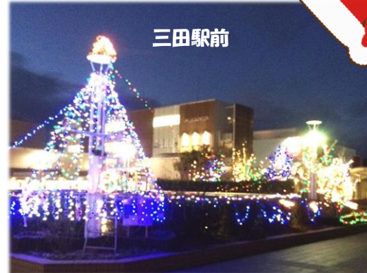
三田市商工会による三田駅周辺のイルミネーション

三田駅前でのオープニングでは、イルミネーションの点灯が行われ、12月23日のメインイベントでは、子どもたちが、サンタバスや‘市役所風の広場’でのさまざまな催しを楽しみました。