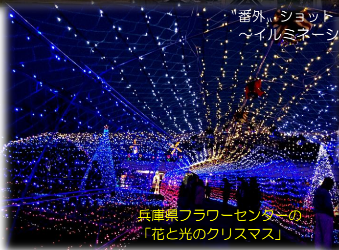
兵庫県フラワーセンターの 「花と光のクリスマス」