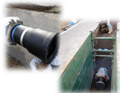
水道管理設工事の現場