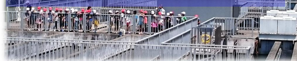
三田カルチャータウン太陽光発電所

三田浄水場は、JR新三田駅と広野駅の間あたり、西野上地区の武庫川沿いにあります。敷地の広さは、甲子園球場の約1.5倍(54,686㎡)。川向こうにJRの電車庫を望み、周辺には田園やなだらかな丘陵がつくるのどかな景色が広がっています。