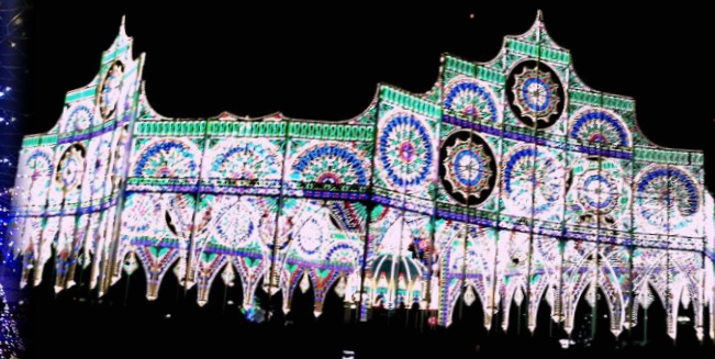
神戸ルミナリエ、今年の幻像