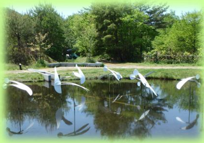
県立有馬富士公園の休養ゾーン

三田市内の県立有馬富士公園や高平ナナマツの森など阪神北摂民局管内にある 30 箇所の里山の一つひとつを“展示物”に見立て、北摂里山博物館と称しています。多くの方が環境学習、野外活動など、それぞれのニーズで気軽に訪れ、思いおもいに利活用できるよう整備し、地域の活性化につなげていこうという取組です。