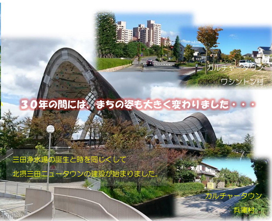
カルチャータウン ワシントン村