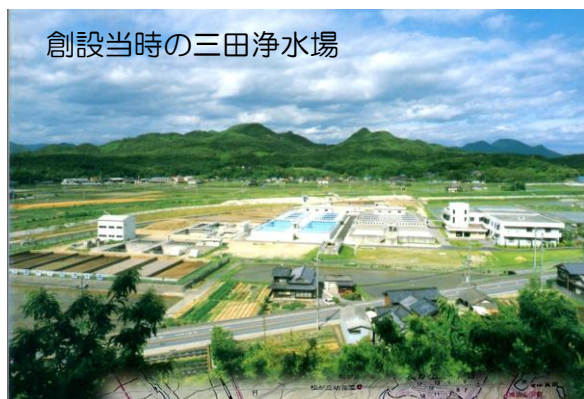
創設当時の三田浄水場

兵庫県企業庁はまもなく創設50年、そして三田浄水場も誕生から30年の節目を迎えています。昭和61年5月から三田市、三木市、加東市へ給水を開始し、現在では小野市や神戸市北区、篠山市へも給水、水量は1日平均でおよそ56,000㎡（25mプール150杯程度の量）となっています。