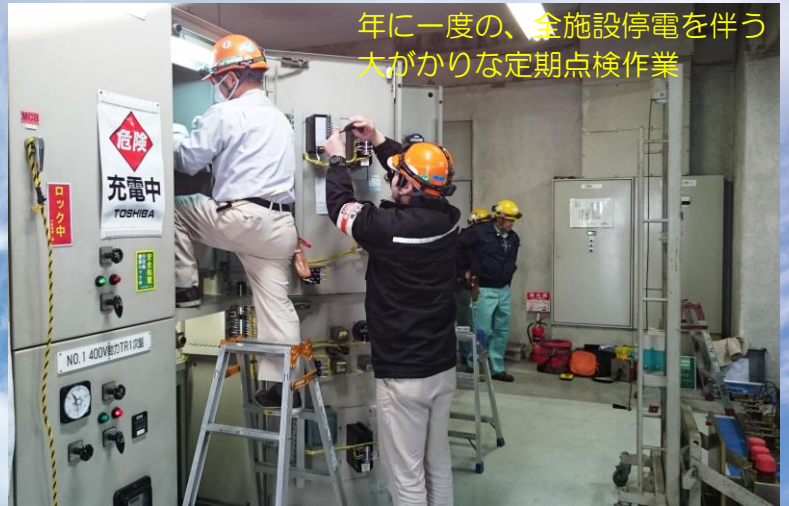
年に一度の、全施設停電を伴う大がかりな定期点検作業