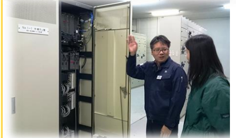
ポンプ設備も薬品注入設備もやはり電気がいのちです

そんなことにならないように、1系統の電気供給が災害や事故で断たれても、2系統の供給ルートでバックアップできる体制をとっています。