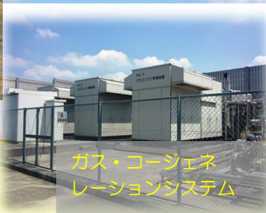
ガス・コージェネレーションシステム

また、常時、水質の状況監視や分析を自動で行っている機器なども同じく電気動いています。夏場など、積乱雲が発生し、雷がゴロゴロいいだして、夕立の気配が出てくるとスタッフたちの緊張が高まります。浄水場以外にも各地の供給点に設けられた局舎やポンプ設備の電気系統に落雷があれば、断水につながる事故が発生するかもしれないからです。