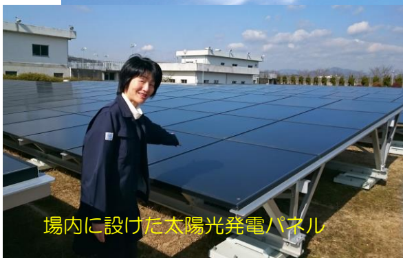
場内に設けた太陽光発電パネル

また、常時、水質の状況監視や分析を自動で行っている機器なども同じく電気動いています。夏場など、積乱雲が発生し、雷がゴロゴロいいだして、夕立の気配が出てくるとスタッフたちの緊張が高まります。浄水場以外にも各地の供給点に設けられた局舎やポンプ設備の電気系統に落雷があれば、断水につながる事故が発生するかもしれないからです。