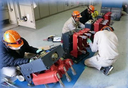
制御盤の入替作業中