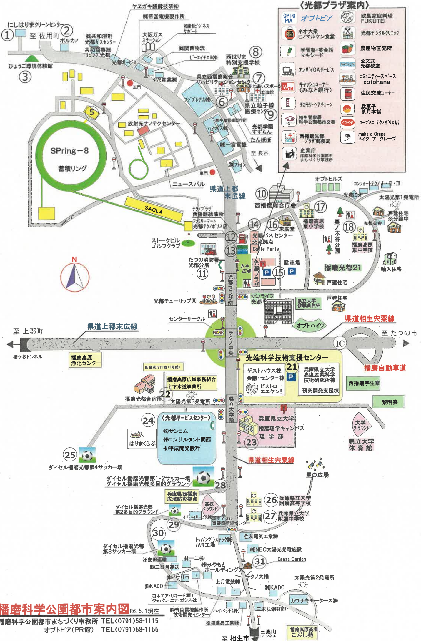
播磨科学公園都市案内図 R6. 5. 1現在 播磨科学公園都市まちづくり事務所 TEL(0791)58-1115 オプトピア(PR館) TEL(0791)58-1155