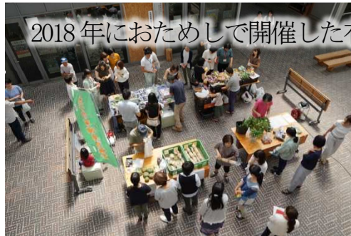
2018年におためしで開催した有機野菜市@光都