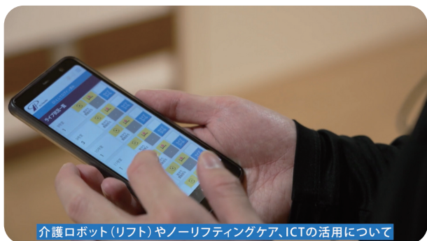
介護ロボット(リフト)やノーリフティングケア、ICTの活用について